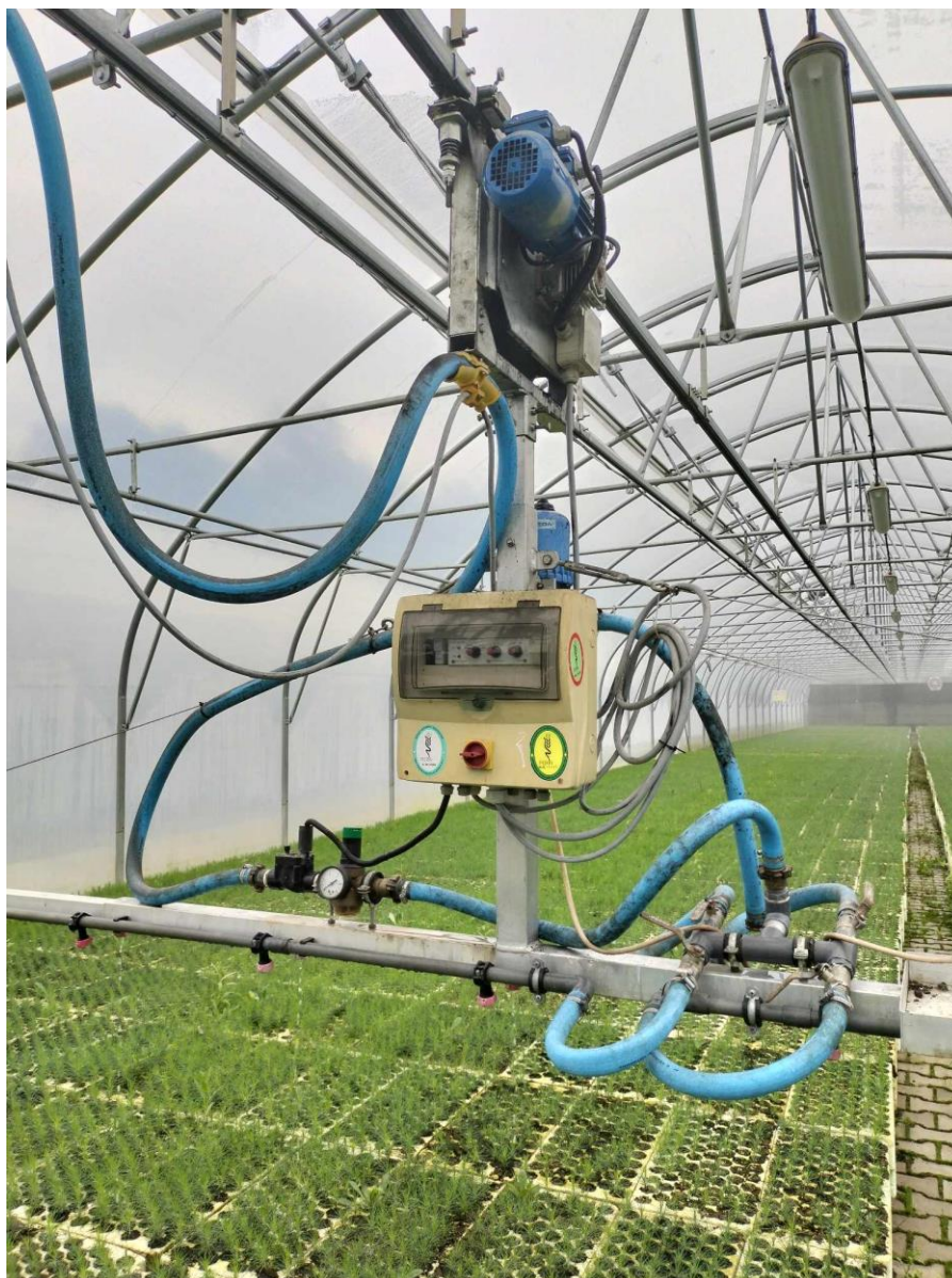
rys. 2. Ramię deszczujące podlegające demontażowi