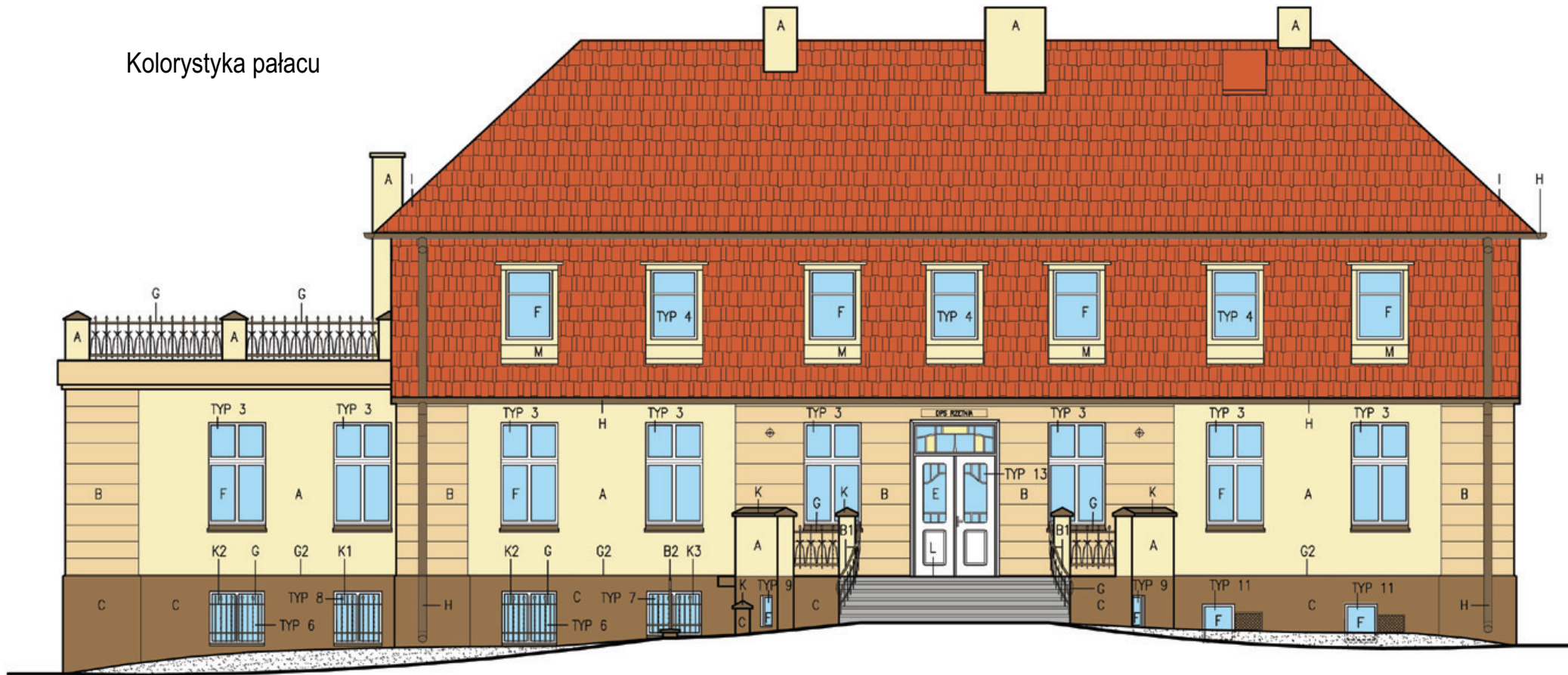
ELEWACJA FRONTOWA (PÓŁNOCNO-ZACHODNIA)