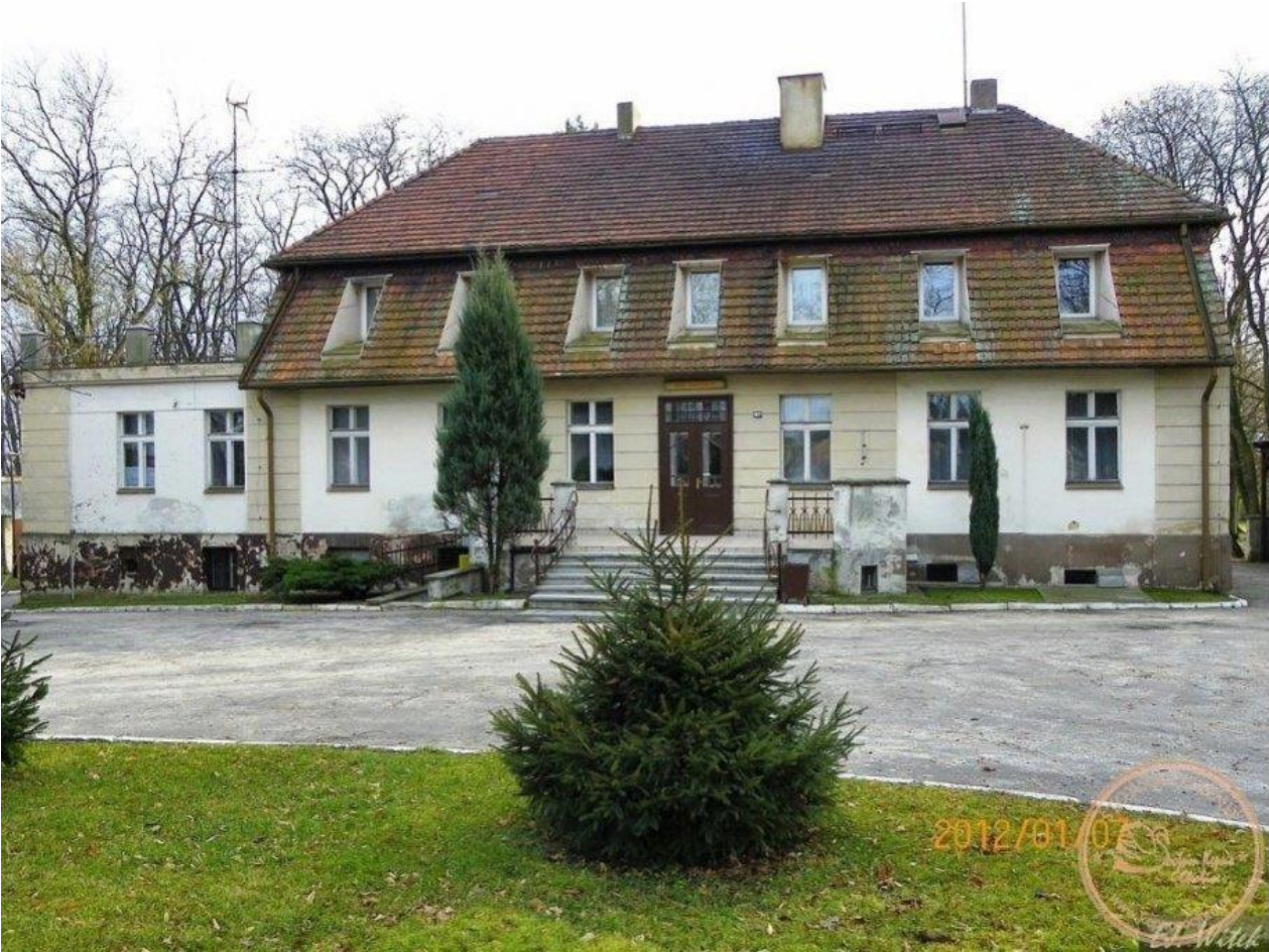
Zdjęcia pałacu przed remontem z roku 2013