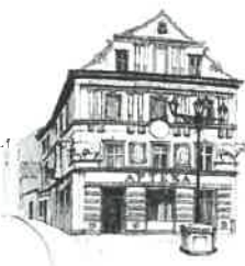
Kamienica „Pod Bykami”