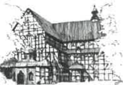
Kościół Pokoju pw. Św. Trójcy Wpisany na listę UNESCO