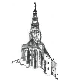
Kościół pw. Św. Stanisława i Św. Waclawa Katedra Diecezji Świdnickiej

Sporządziła: I. Fecko Stanowisko: Inspektor tel. 74 856-28-50