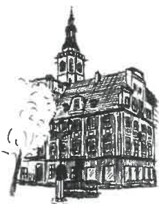
Rynek Wieża ratuszowa