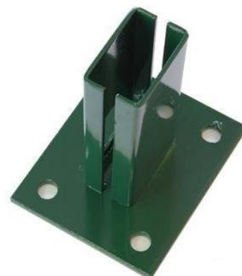
Podstawa stalowa do montażu na kołki rozporowe na elementach betonowych