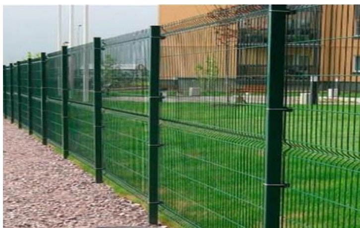
Ogrodzenie panelowe montowane na słupkach w fundamentach betonowych