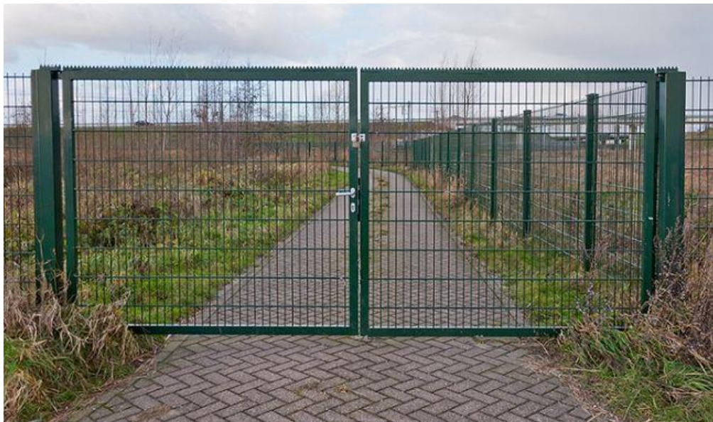
Brama dwuskrzydłowa z zamkiem