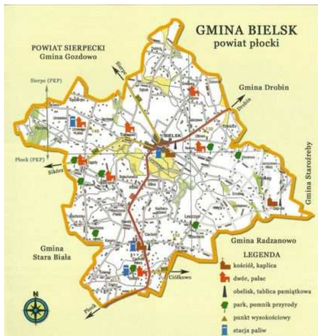
mapa Gminy Bielsk

Projekt realizowany będzie na obszarze województwa mazowieckiego, w powiecie plockim.