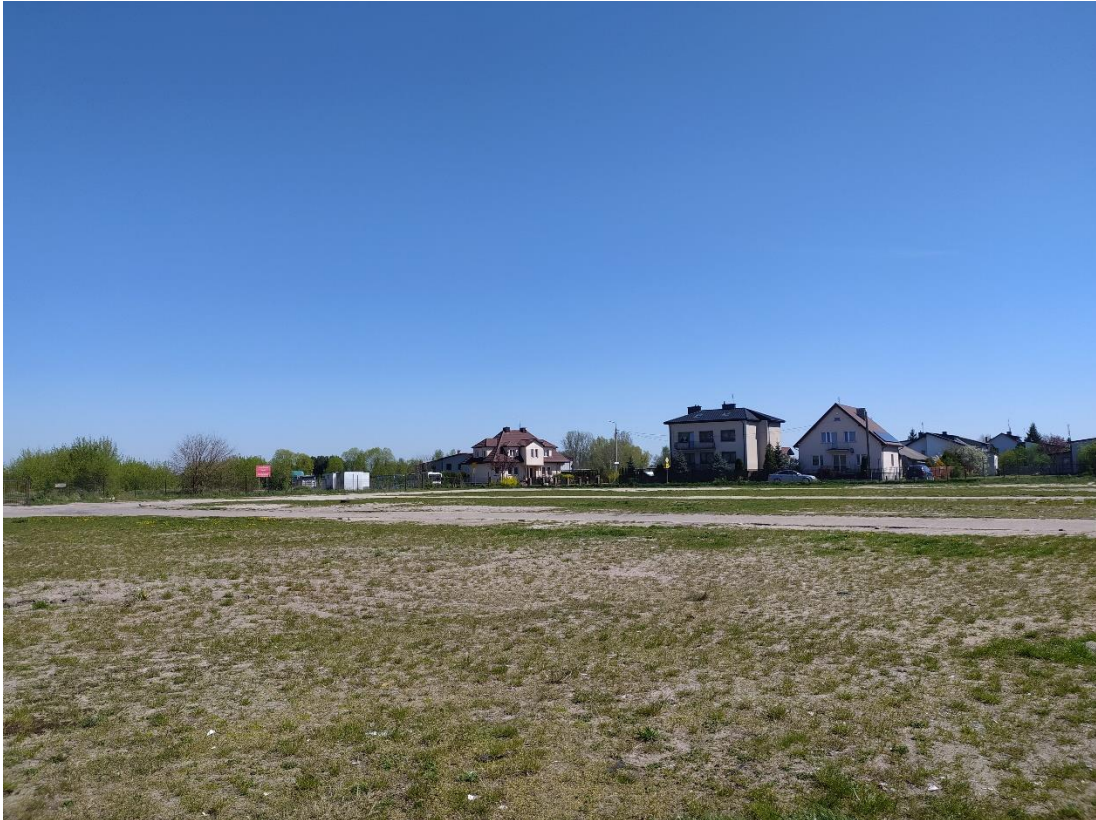
Rys. 9. Widok w kierunku zachodnim