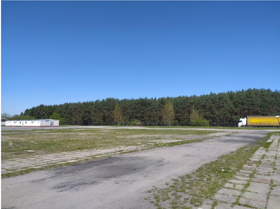
Rys. 7. Widok w kierunku południowym