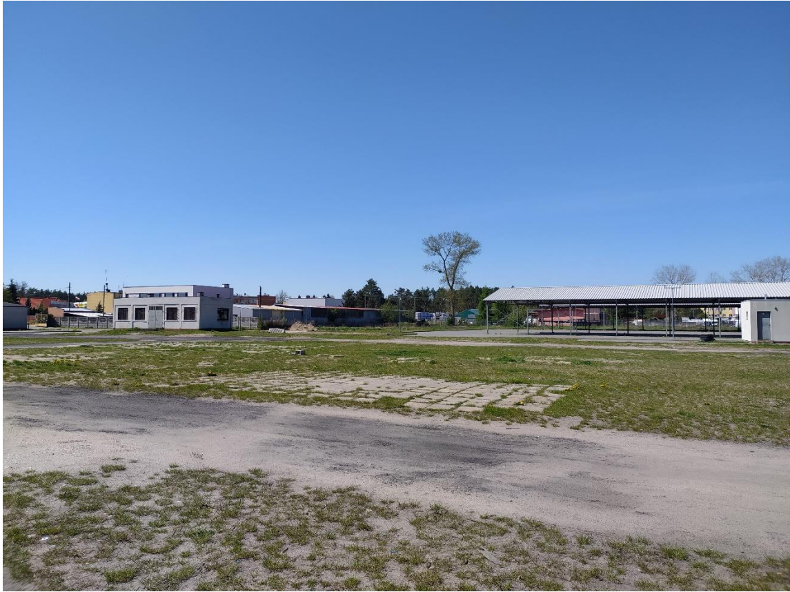
Rys. 5. Widok w kierunku wschodnim