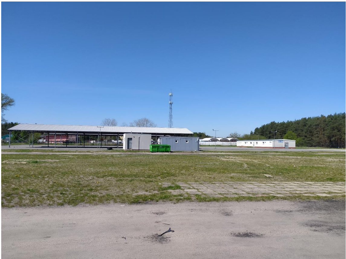
Rys. 6. Widok w kierunku południowo-wschodnim