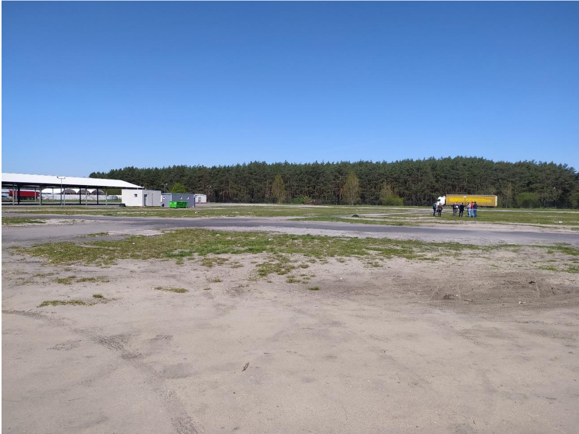
Rys. 11-21. Widok ogólny oraz widok powierzchni sztucznych