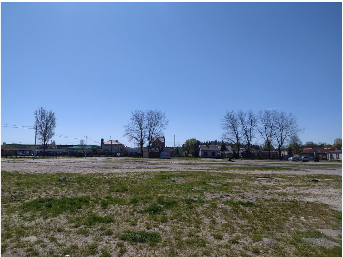
Rys. 4. Widok w kierunku północno-wschodnim