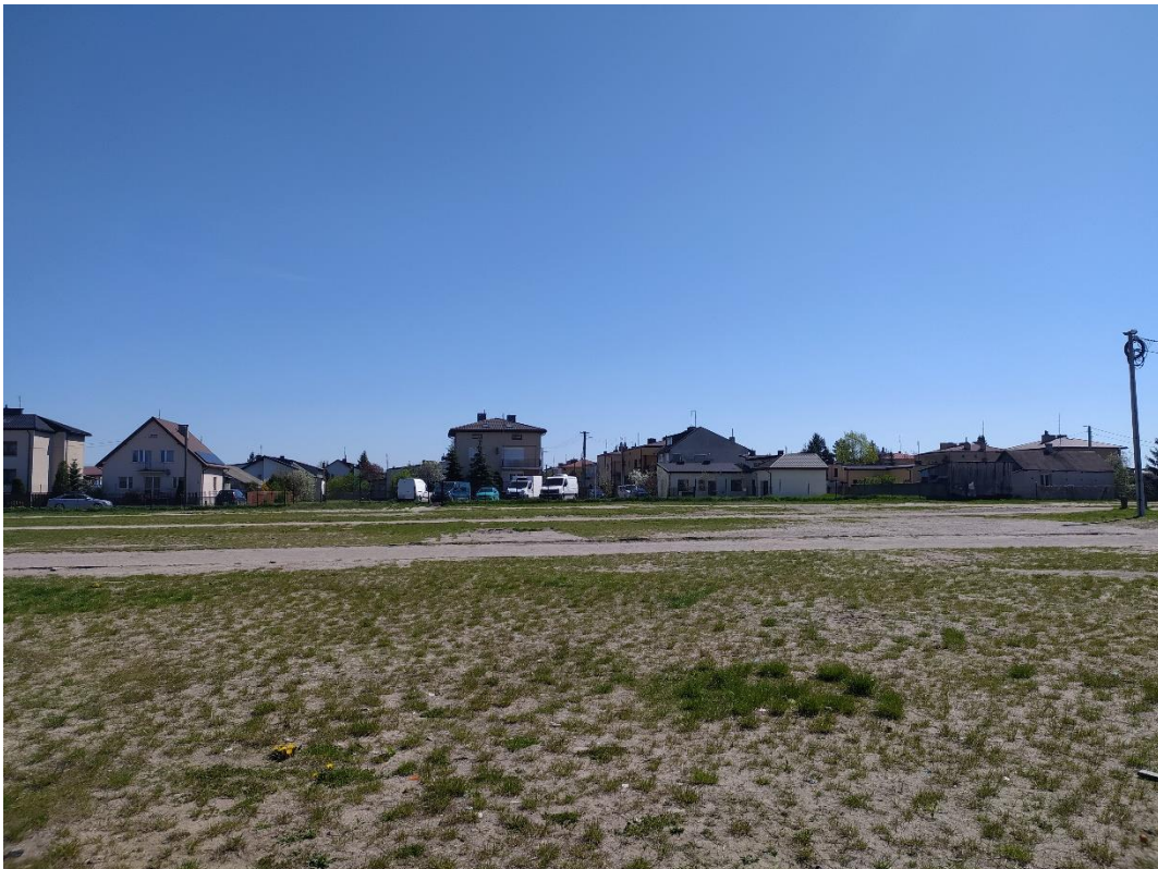
Rys. 10. Widok w kierunku północno-zachodnim