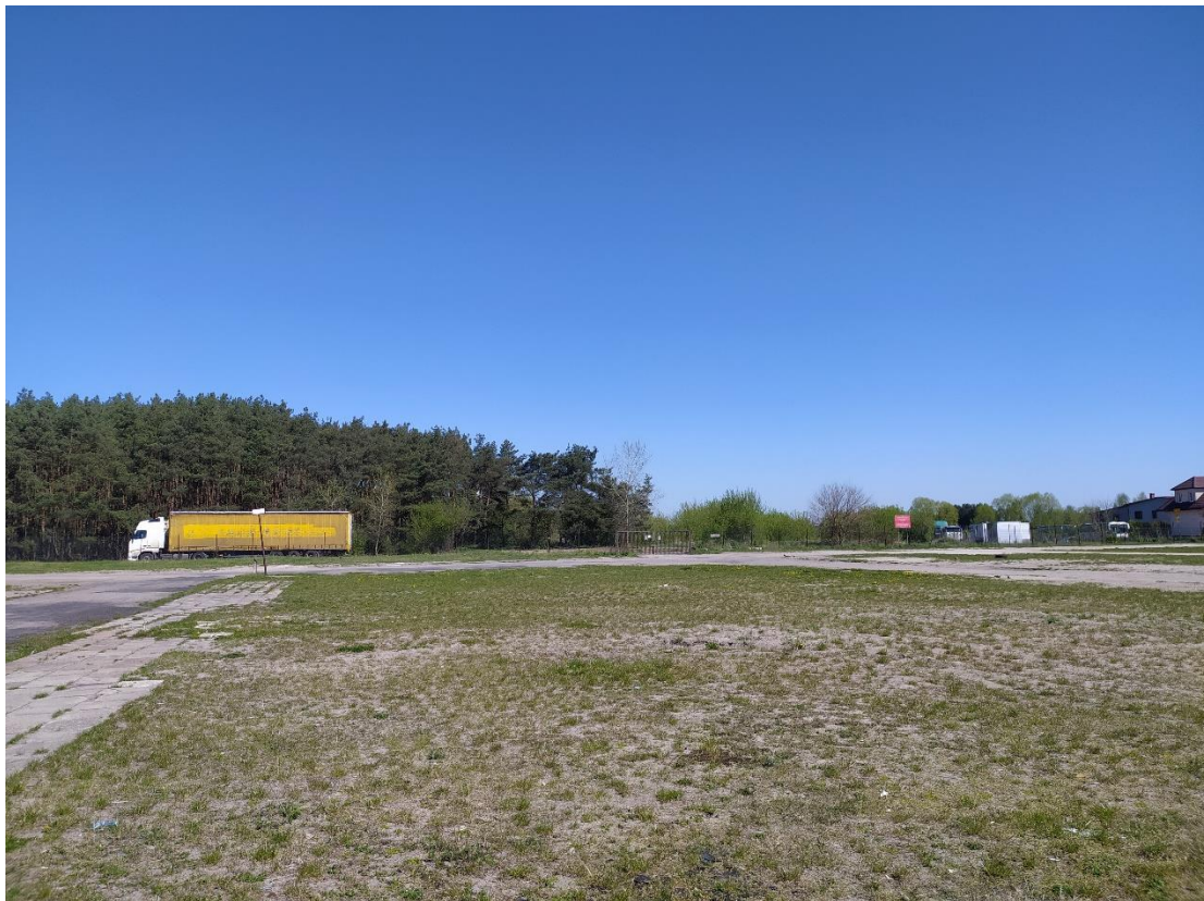
Rys. 8. Widok w kierunku południowo-zachodnim