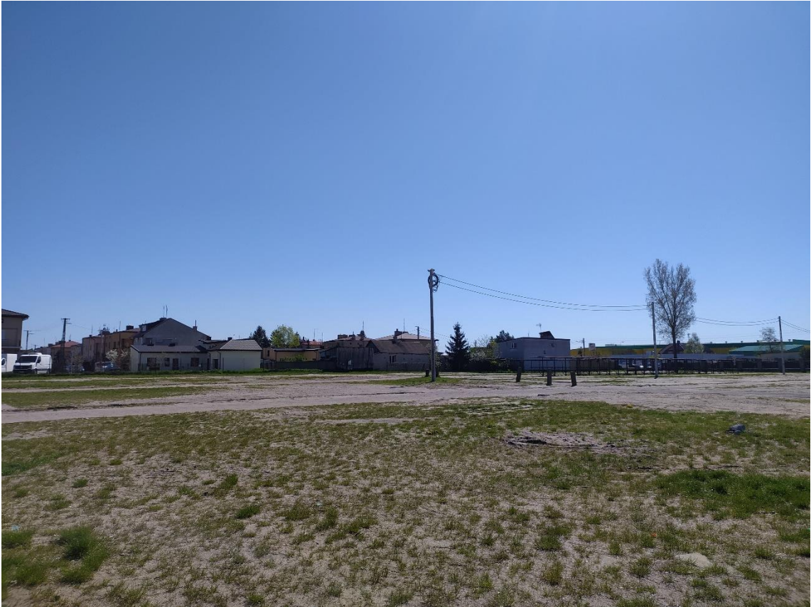
Rys. 3. Widok w kierunku północnym