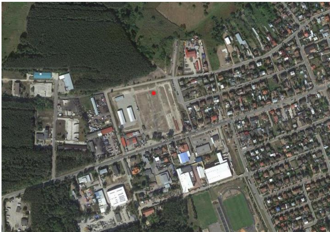
Rys.1. Proponowana lokalizacja na tle ortofotomapy

Odwiedzono jedną wybraną lokalizację – teren działki nr 731/3 obręb Białobrzegi, będącej własnością gminy Białobrzegi.