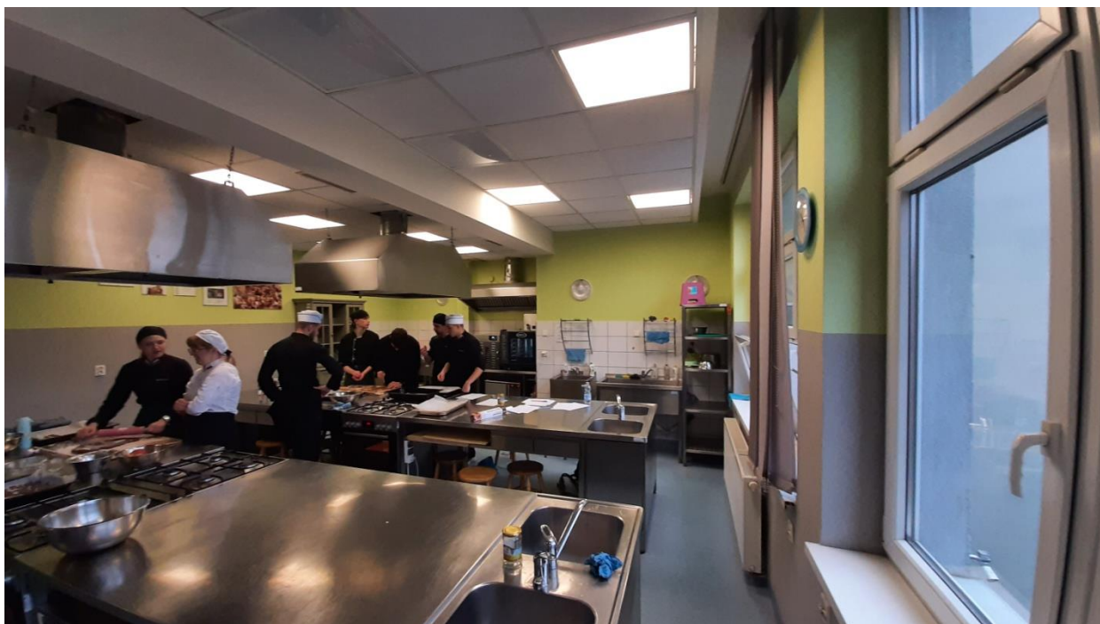
Fotografia nr 4 – Sala nr 110