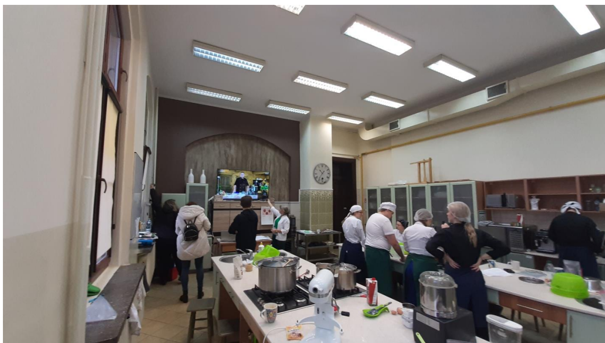
Fotografia nr 3 – Sala nr 111