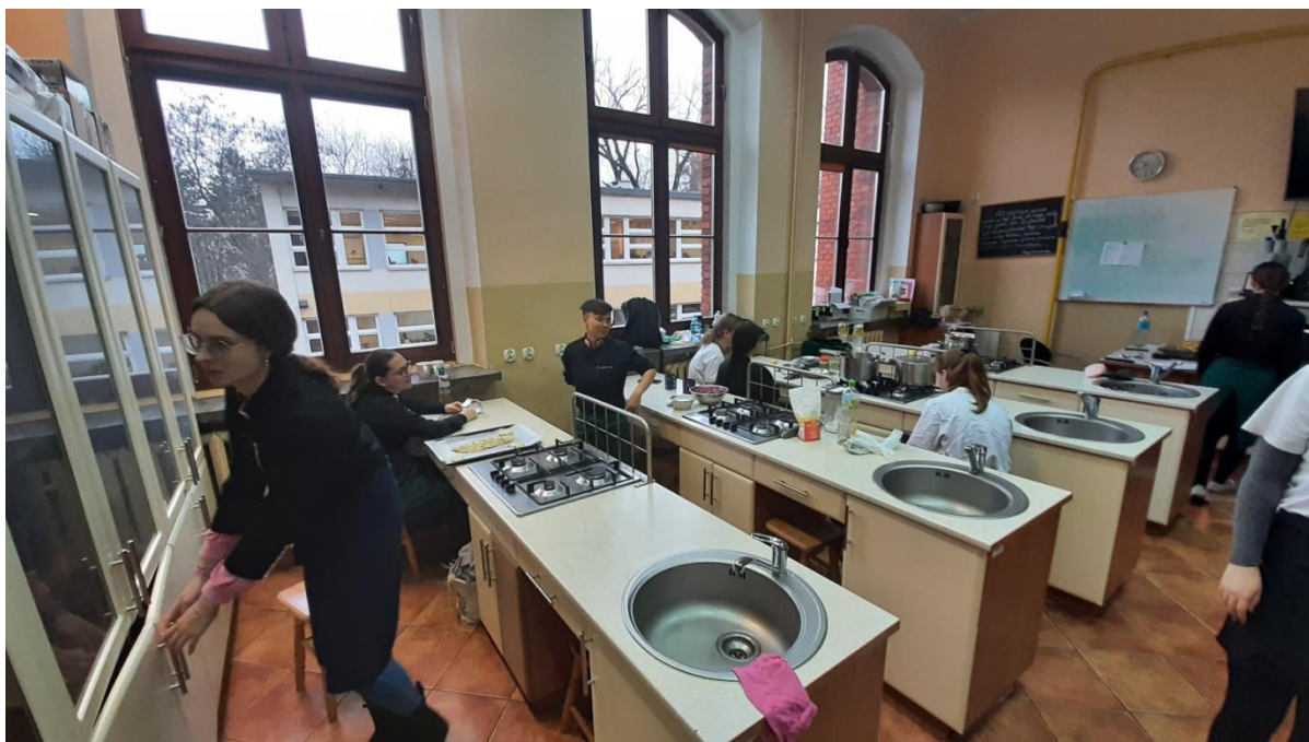
Fotografia nr 2 – Sala nr 107