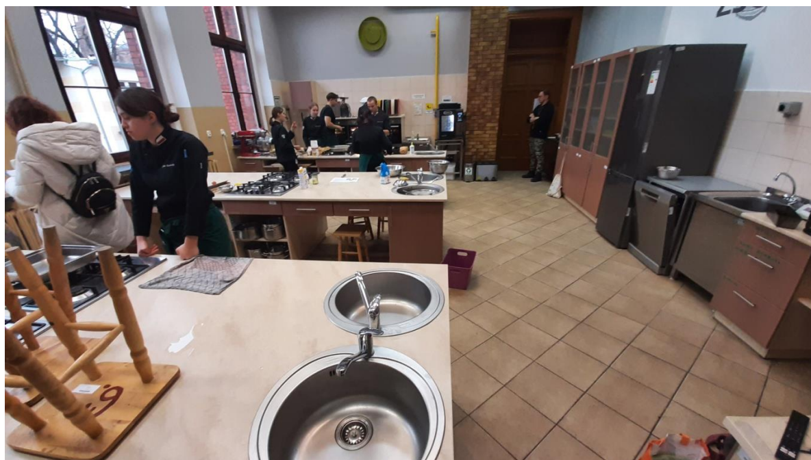
Fotografia nr 1 – Sala nr 106

W zakresie inwentaryzacji wykonano pomiary, odległości zmierzono dalmierzem laserowym i odwzorowano graficznie w świetle ścian wyprawionych. Powierzchnię pomieszczeń zliczono wg ścian wyprawionych. Pomiary uzupełniano i weryfikowano przy użyciu taśmy stalowej.