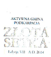
Skuteczny beneficjent środków unijnych