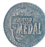
Wyróżnienie w kat. „Inwestor na Medal” w konkursie „Budowniczy Polskiego Sportu”