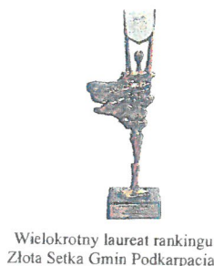
Wielokrotny laureat rankingu Złota Setka Gmin Podkarpacia