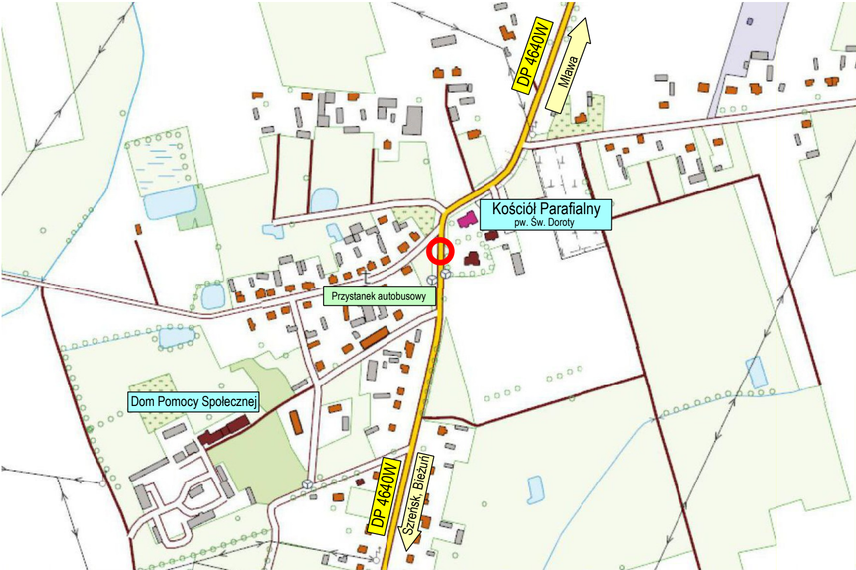
Lokalizacja ogólna - skala 1:5 000