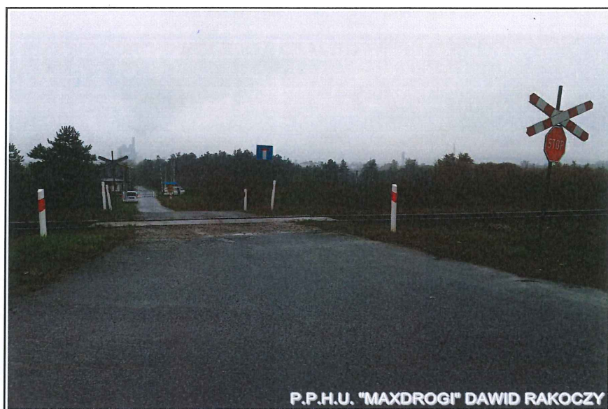
- strona prawa-