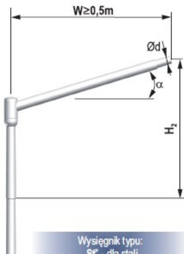
Wysięgnik typu: „St” - dla stali „AL” - dla aluminium