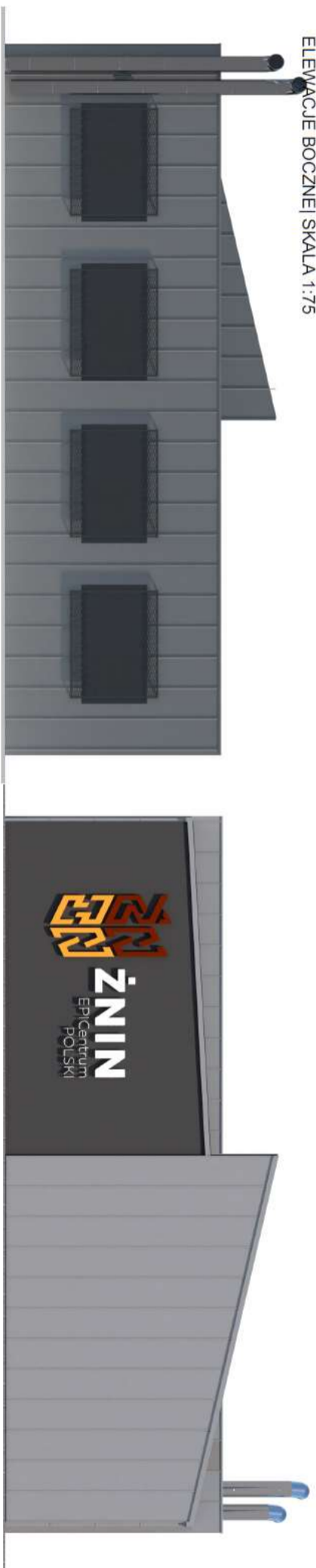
ELEWACJE BOCZNE | SKALA 1:75