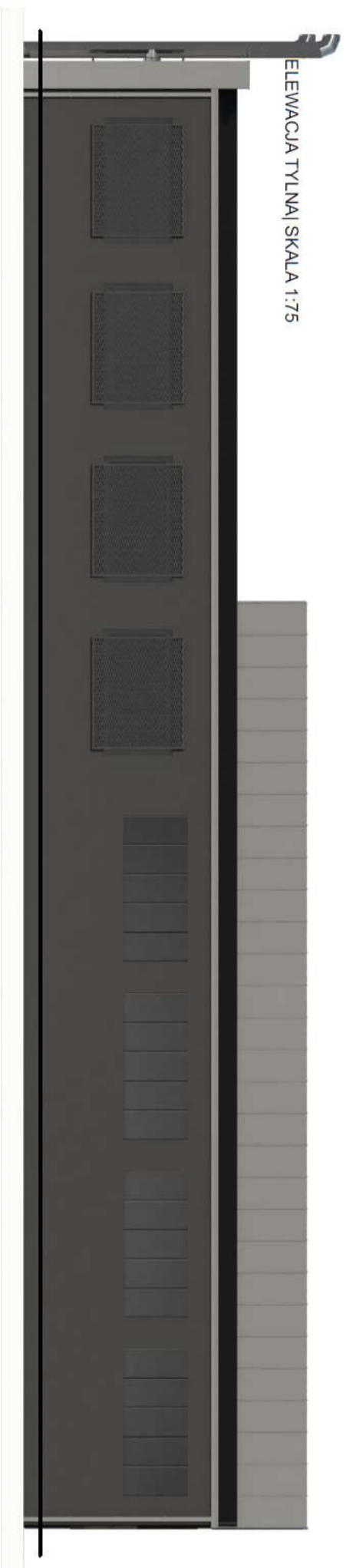
ELEWACJA TYLNA | SKALA 1:75