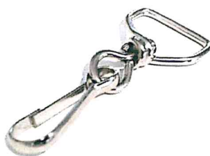
Karabińczyk typu agrafka