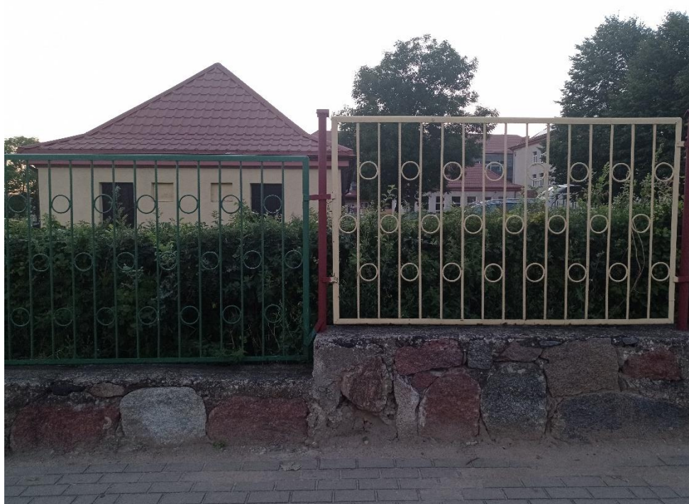
Fot. 3. Przęsła ogrodzenia zewnętrznego na podmurówce kamiennej (widoczna różnica wysokości podmurówki) i przylegający żywopłot