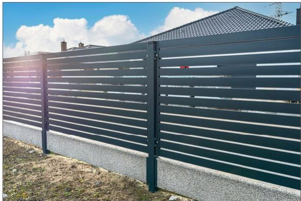
PRZĘŚŁO, DESKA BETONOWA - PRZYKŁAD