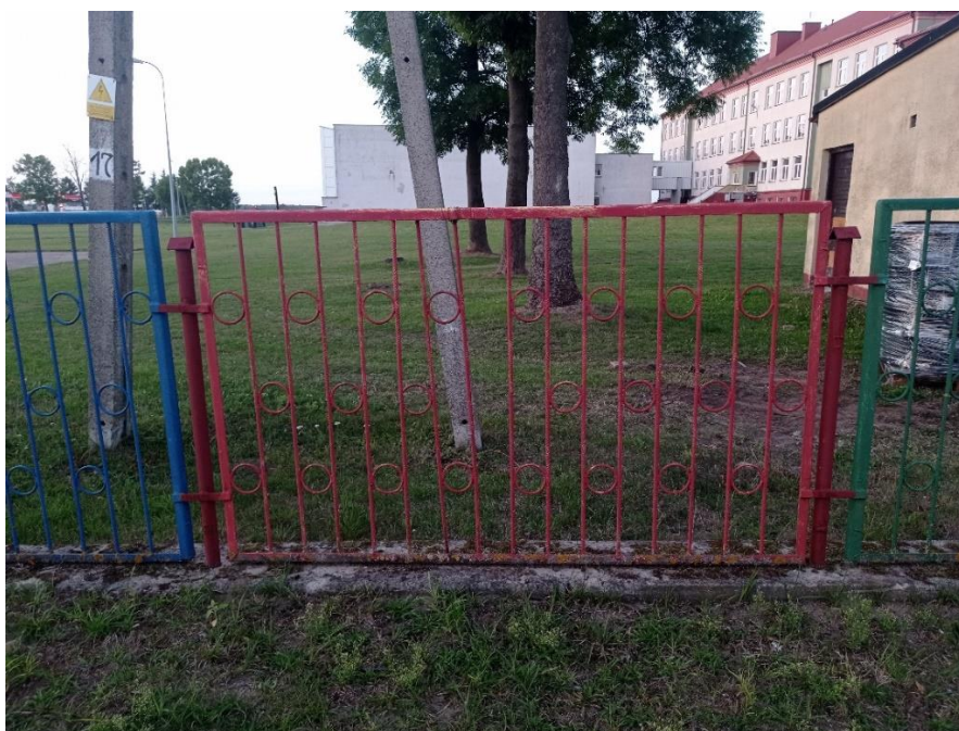
Fot. 1. Przęsło ogrodzenia zewnętrznego