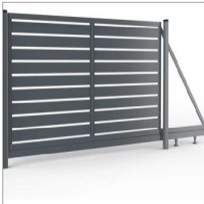
BRAMA - PRZYKŁAD