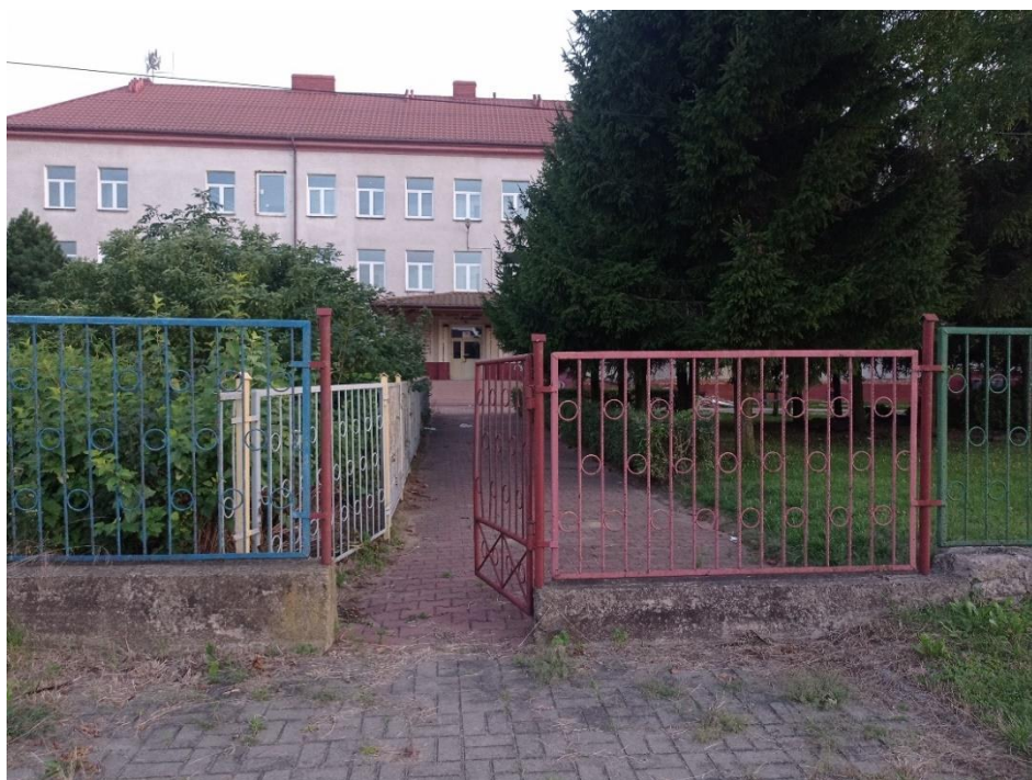
Fot. 5. Ogrodzenie zewnętrzne – bramka BR1 (ul. Armii Krajowej), do likwidacji