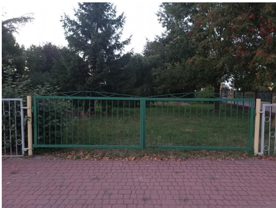
Fot. 11. Ogrodzenie wewnętrzne – brama B4