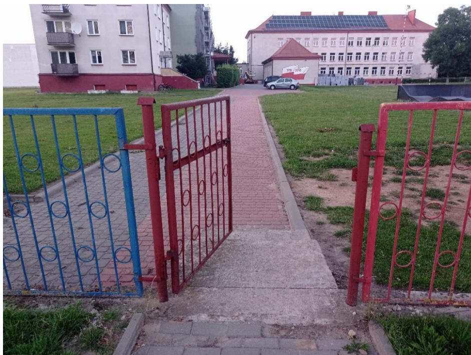
Fot. 9. Ogrodzenie zewnętrzne – bramka BR3 (ul. Szkolna), do zastąpienia bramą i bramką