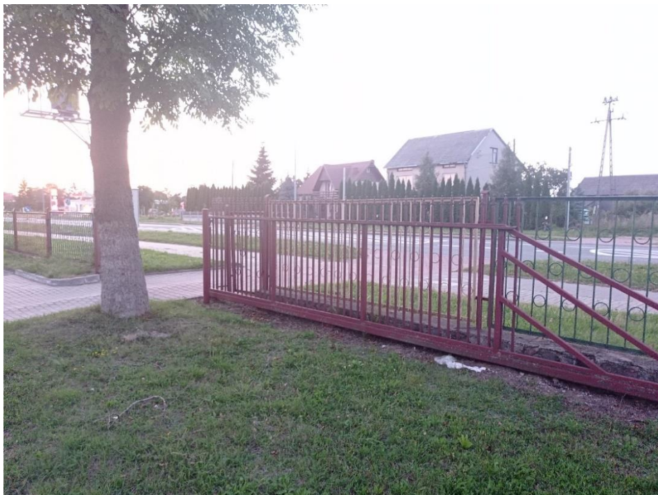
Fot. 4. Ogrodzenie zewnętrzne – brama B1 (ul. Armii Krajowej)