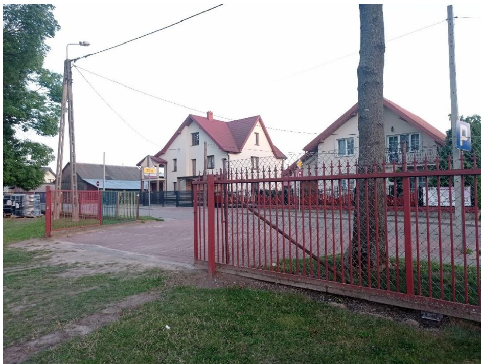
Fot. 8. Ogrodzenie zewnętrzne – brama B3 (ul. Szkolna)