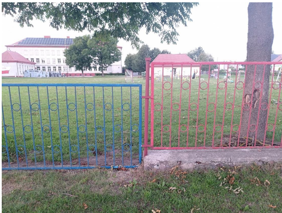
Fot. 2. Przęsła ogrodzenia zewnętrznego na podmurówce betonowej i kamiennej (widoczna różnica wysokości podmurówki)