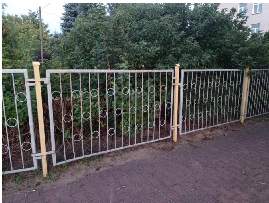
Fot. 10. Przęsło i słupki ogrodzenia wewnętrznego