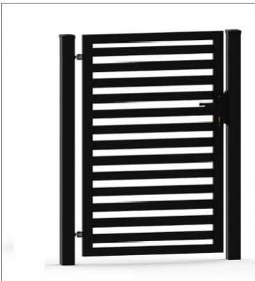
BRAMKA - PRZYKŁAD