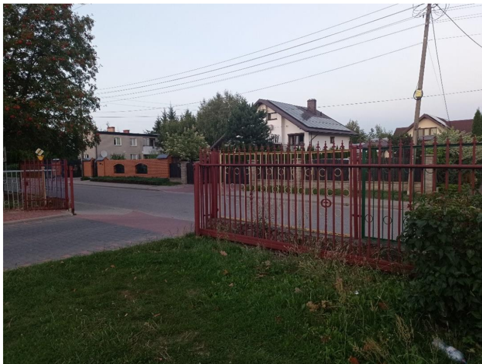
Fot. 6. Ogrodzenie zewnętrzne – brama B2 (ul. Błonie)