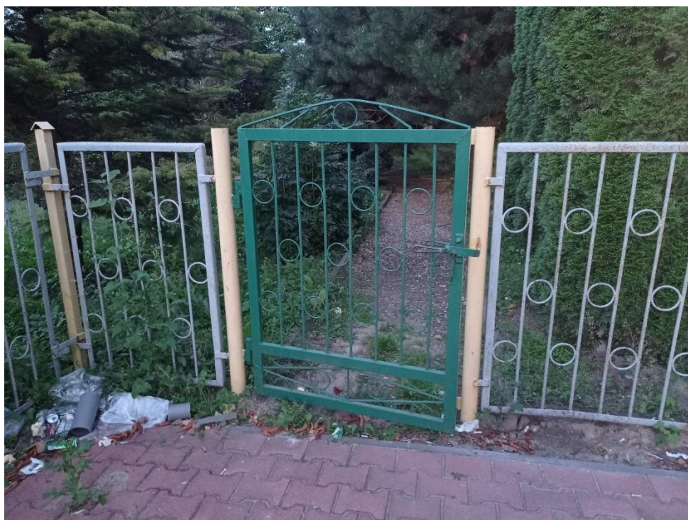
Fot. 12. Ogrodzenie wewnętrzne – bramka BR4