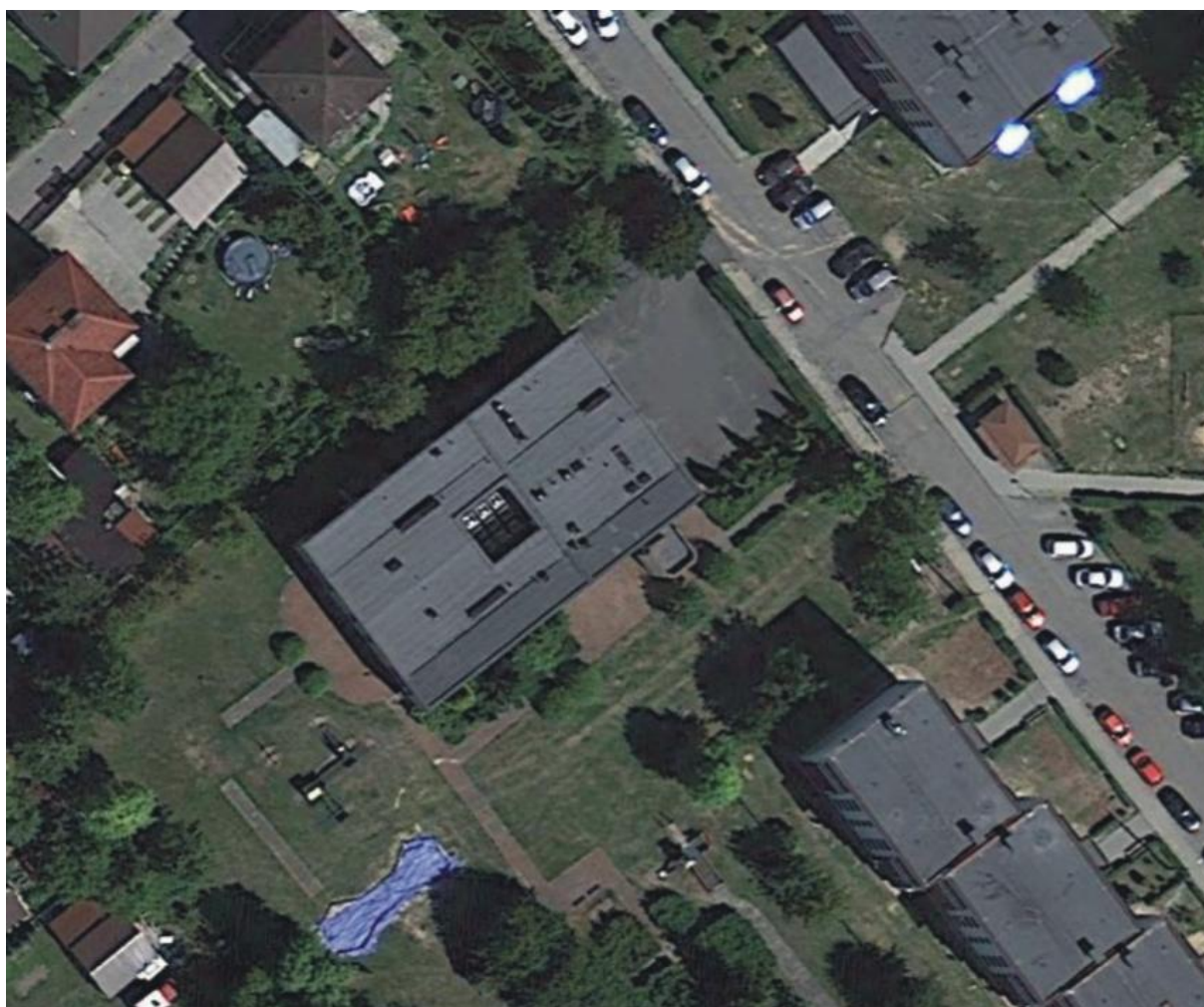
Fot. 1. Budynek przy ulicy Fredry 16 w Jaworznie

Inwentaryzowany obiekt to dwukondygnacyjny budynek przedszkolny. Brak drożnych otworów wentylacyjnych stropodachu.