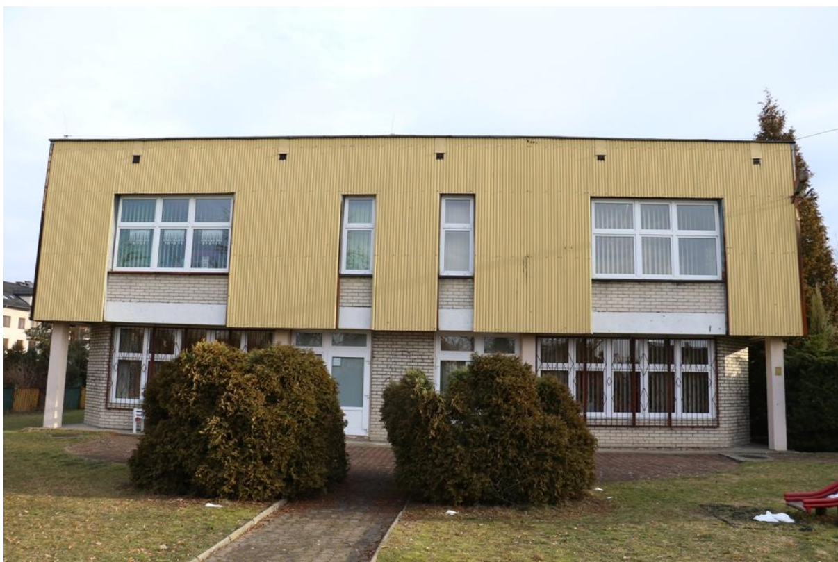
Fot. 5. Fredry 16, Jaworzno - ściana południowo-zachodnia