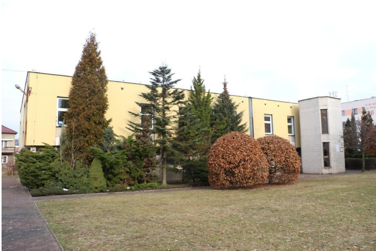
Fot. 4. Fredry 16, Jaworzno - ściana południowo-wschodnia