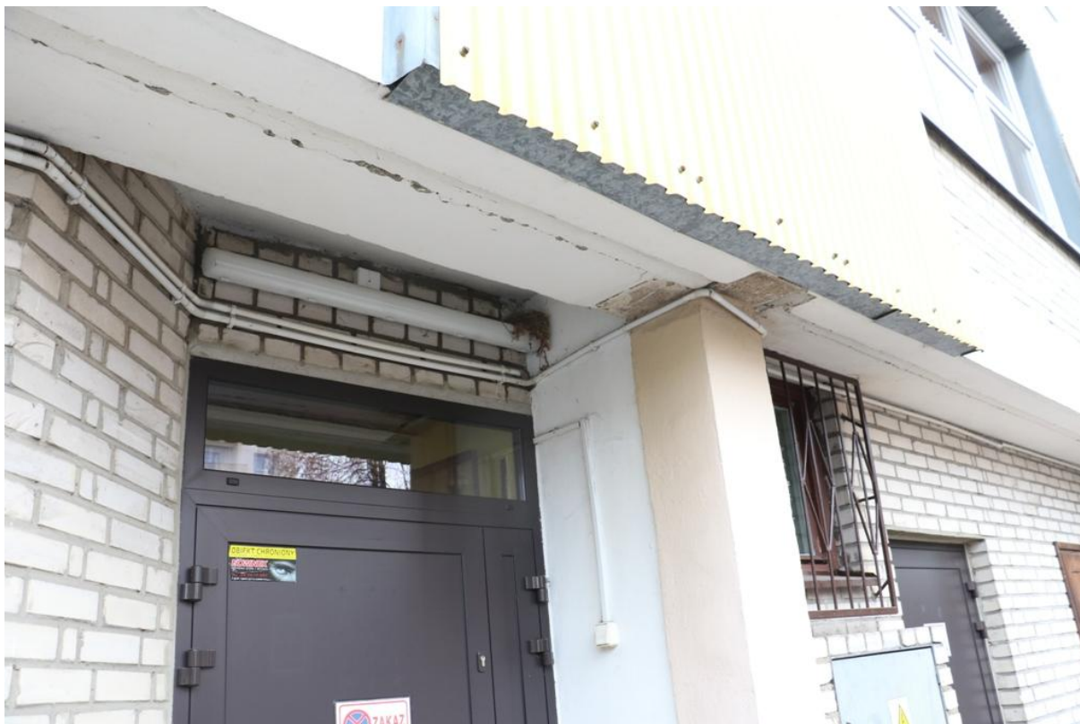
Fot. 6. Fredry 16, Jaworzno - ściana północno-wschodnia, gniazdo kopciuszka