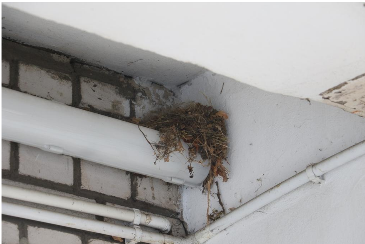
Fot. 7. Fredry 16, Jaworzno - ściana północno-wschodnia, gniazdo kopciuszka