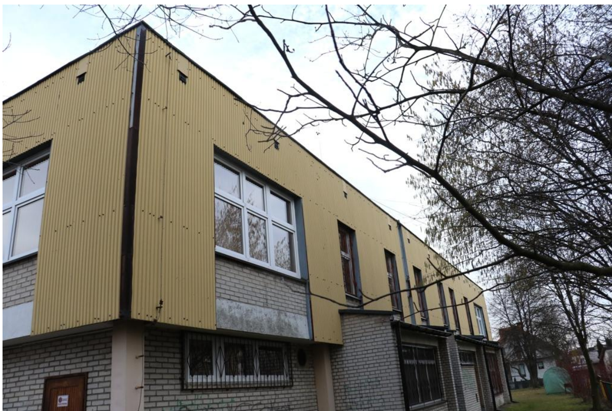
Fot. 3. Fredry 16, Jaworzno - ściana północno-zachodnia