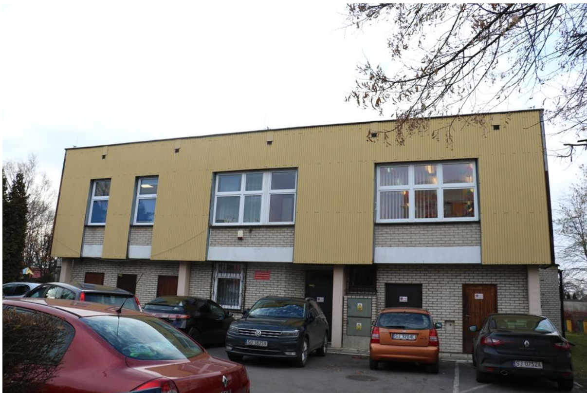
Fot. 2. Fredry 16, Jaworzno - ściana północno-wschodnia