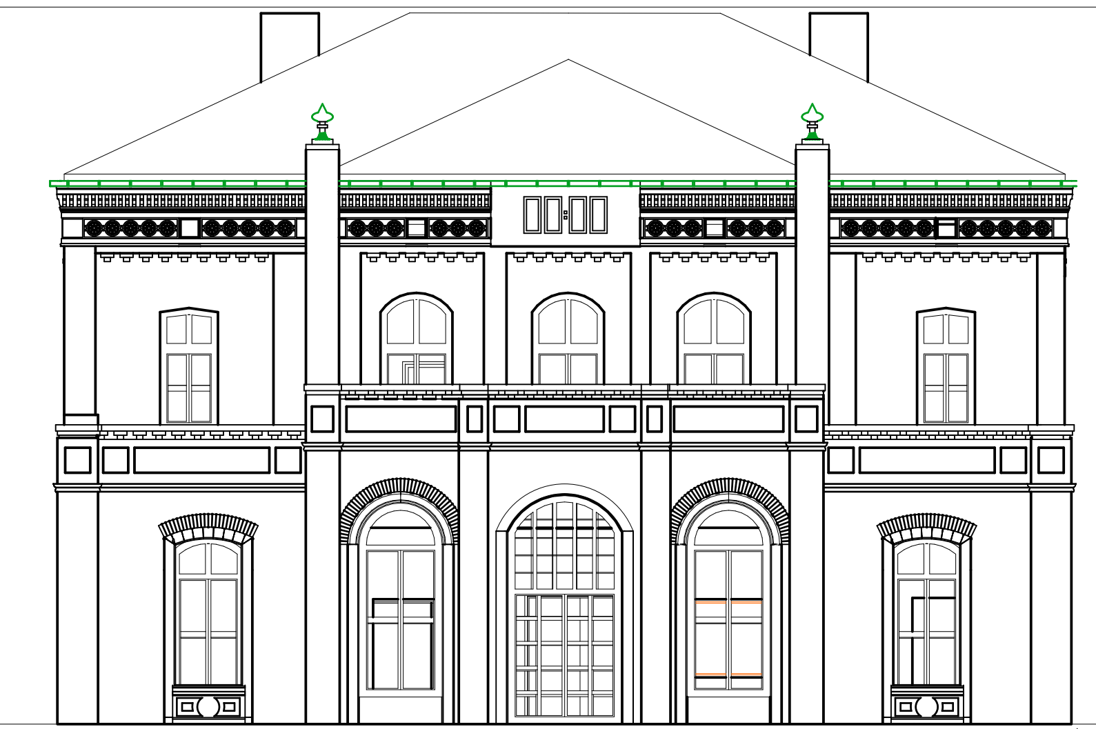
ELEWACJA PÓLNO-CZYSTO-ZACHODNIA SKALA 1:100