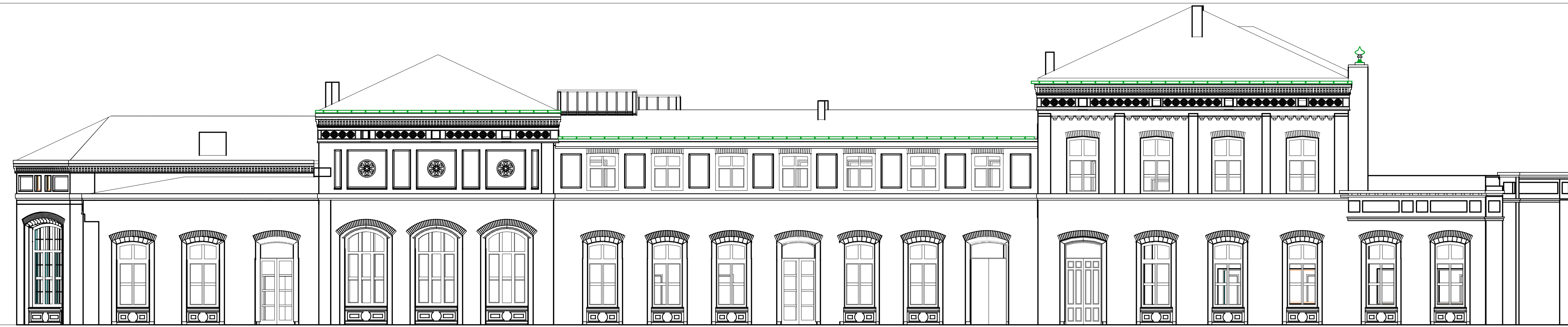
ELEWACJA PÓLNO-CZYSTO-ZACHODNIA SKALA 1:100