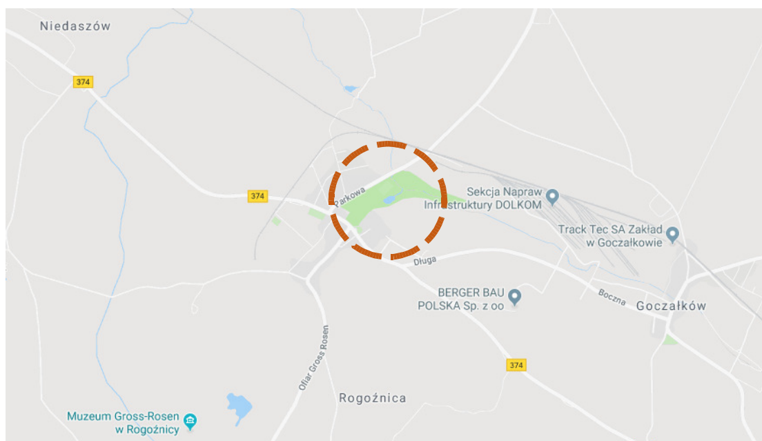
Rys. 1. Lokalizacja parku

DZ. NR 203/4, 203/6, 203/8; OBRĘB: 0014, Rogoźnica