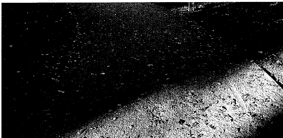
RYC. 2. PRZYKŁAD NAWIERZCHNI Z KRUSZYWA Z OBRZEŻEM METALOWYM

Dla optymalizacji kosztów przy ścieżkach prowadzących po obwodzie założenia można całkowicie zrezygnować z obrzeży.