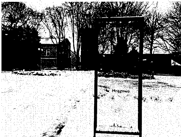
RYC. 5. PRZYKŁADOWA TABLICA INFORMACYJNA POKAZUJĄCA NIEISTNIEJĄCY OBIEKT W ZASTANYM KONTEKŚCIE PRZESTRZENNYM:

https://lh3.googleusercontent.com/proxy/Lm1lpKusifjLvgvGzBnlreqDnQ7_CeuDNj-7EXuE-O5hHHgjf1X2VbssCtx3IJ7kXm55t19GEA_xgjYk93CeH1qnJdk3u-FMuX0kJgMh2flm_CzuXI6Ejrpsea32M_LpxXJydZOFoHJhmzQNeg