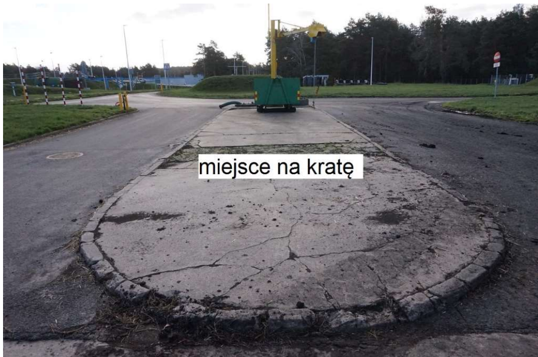
Rys. 3 Widok punktu zlewczego