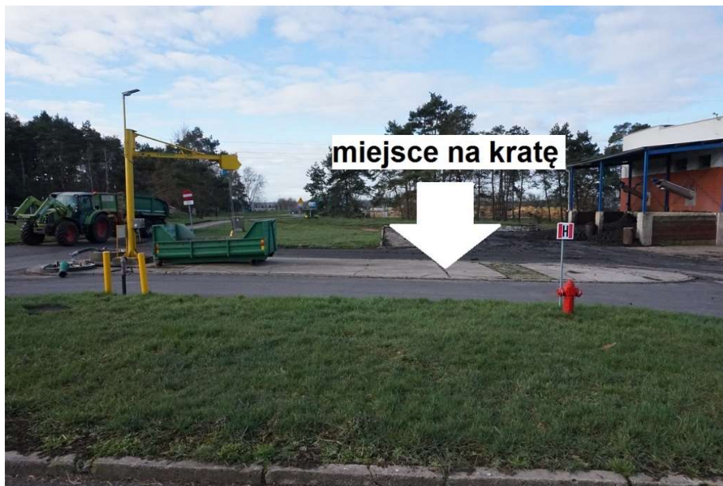
Rys. 4 Widok punktu zlewczego