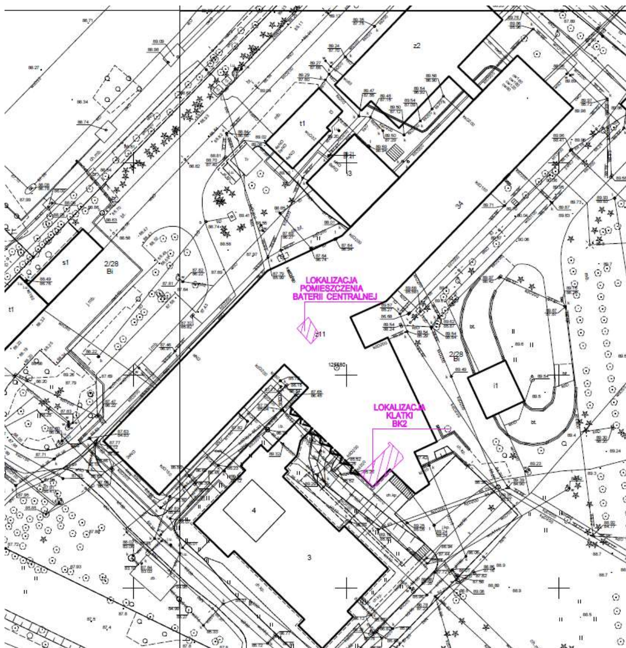
Rysunek nr 1-Lokalizacja klatki schodowej BK2

Klatka BK2 zlokalizowana jest w południowo-wschodniej części budynku wysokiego (łózkowego) znajdującego się na terenie szpitala Samodzielnego Publicznego Zakładu Opieki Zdrowotnej Ministerstwa Spraw Wewnętrznych w Poznaniu im prof. Ludwika Bierkowskiego przy ul. Dojazd 34 w Poznaniu. Klatka schodowa BK2 łączy kondygnacje od -1 do 10. Przy klatkach schodowych znajdują się przedsionki (wyjątek stanowi kondygnacja -1, 0 i 10) prowadzące na oddziały szpitalne, częściowo są to oddziały z pacjentami chorymi na COVID-19. Pomieszczenie techniczne dla baterii centralnej zlokalizowane jest w przyziemiu budynku Polikliniki.