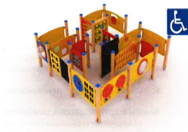
Zestaw integracyjny nr kat PRO ST 104