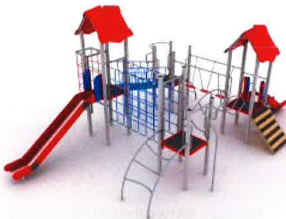
Zestaw zabawowy nr kat Pro ST 202