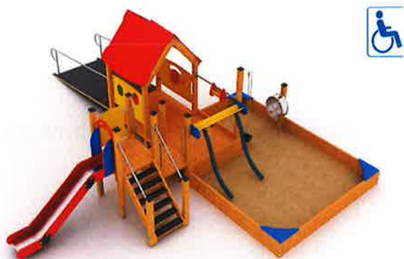
Zestaw integracyjny nr kat Pro ST 102