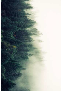
Grafika ścienna laminowana

UWAGA : Jakościowiek wskazane w opisie przedmiotu zamówienia, nazwy produktów i surowców lub ich producenci mają na celu jedynie przybliżenie wymagań, których nie można było opisać przy pomocy dostatecznie dokładnych i zrozumiałych określeń. Wszelkie nazewnictwo kolorystyki płyt meblowych, zawarte w opisie przedmiotu zamówienia poprzez podanie konkretnej nazwy producenta płyty należy traktować jedynie jako wskazówkę ułatwiającą identyfikację typu płyty, posiadanej przez zamawiającego Wszystkie wymiary sprawdzić i uzgodnić na budowie