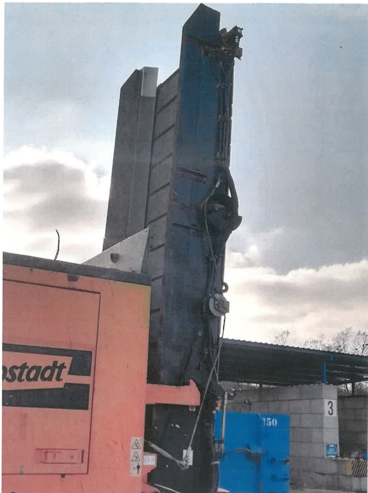
Rysunek 3. Lewy bok tylnego taśmociągu.