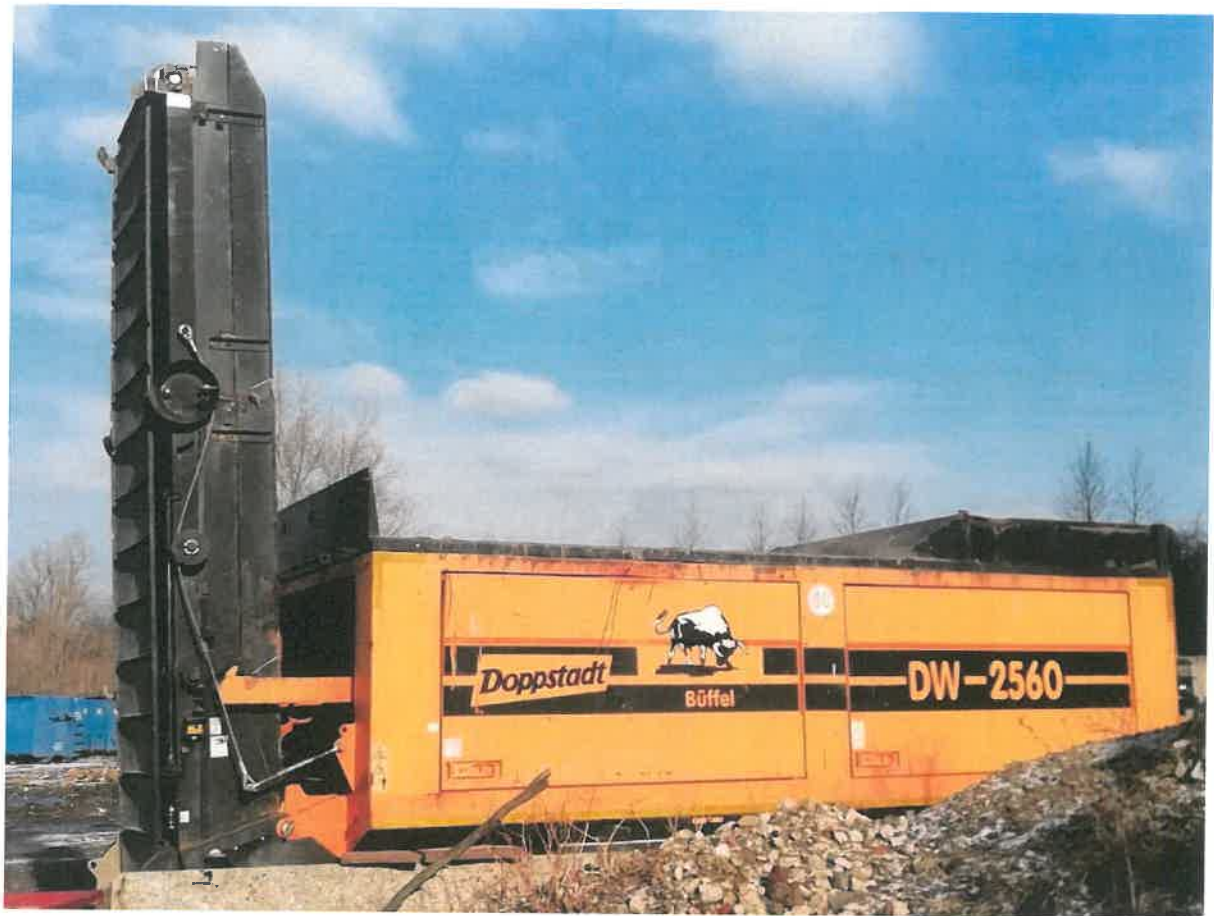
Rysunek 4. Prawy bok rozdrabniarki.