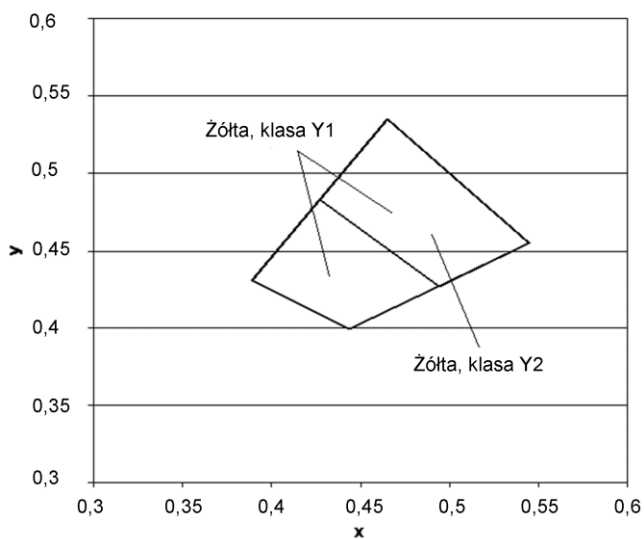
Rys.2. Współrzędne chromatyczności x,y dla barwy żółtej oznakowania