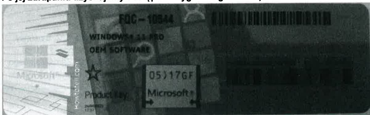
Rys. 1 przykładowy kod zabezpieczony przez producenta systemu Microsoft Windows 11 (takie same naklejki mają Windows 10) z wymazanym, znajdującym się przed i za szarą naklejką kodem licencyjnym

„Wykonawca zobowiązany jest do dostarczenia fabrycznie nowego systemu operacyjnego nieużywanego oraz nie aktywowanego nigdy wcześniej na innym urządzeniu oraz pochodzącego z legalnego źródła sprzedaży. W przypadku systemu operacyjnego naklejka hologramowa winna być zabezpieczona przed możliwością odczytania klucza za pomocą zabezpieczeń stosowanych przez producenta”? Poniższe zdjęcie obrazuje obecnie stosowane zabezpieczenia producenta firmy Microsoft (klucz systemu jest zabezpieczony naklejką hologramową przez producenta. Po jej zdrapaniu uzyskujemy dostęp do oryginalnego klucza):