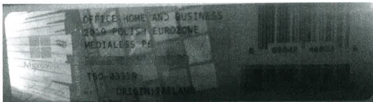
Rys. 2 przykładowy kod zabezpieczony przez producenta systemu Microsoft Windows Office Home&Business z wymazanym, znajdującym się w prawym dolnym rogu numerem seryjnym produktu. Kod licencyjny znajduje się w środku szczelnie zapakowanego i zafoliowanego pudełka (Rys. 3)