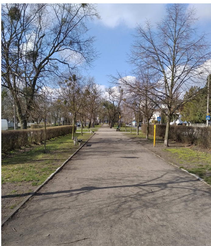
widok alei spacerowej ul. 11 Listopada