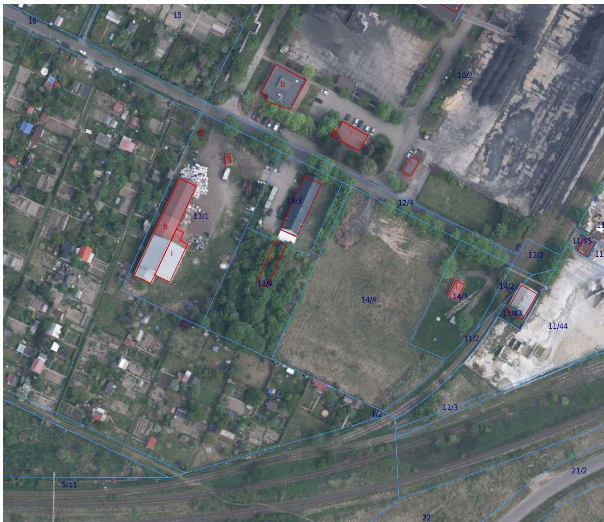
Rysunek 1. Planowany teren inwestycji – dz. nr 14/4.

Planowana Kotłownia na biomasę zostanie zlokalizowana na działce nr ewid. 14/4, obręb AM37 w Oleśnicy przy ul. Ciepłej. Tytuł prawny do działki posiada Gmina Oleśnica. Wieczystym użytkownikiem tego terenu jest MIEJSKA GOSPODARKA KOMUNALNA SPÓŁKA Z O.O. W OLEŚNICY.