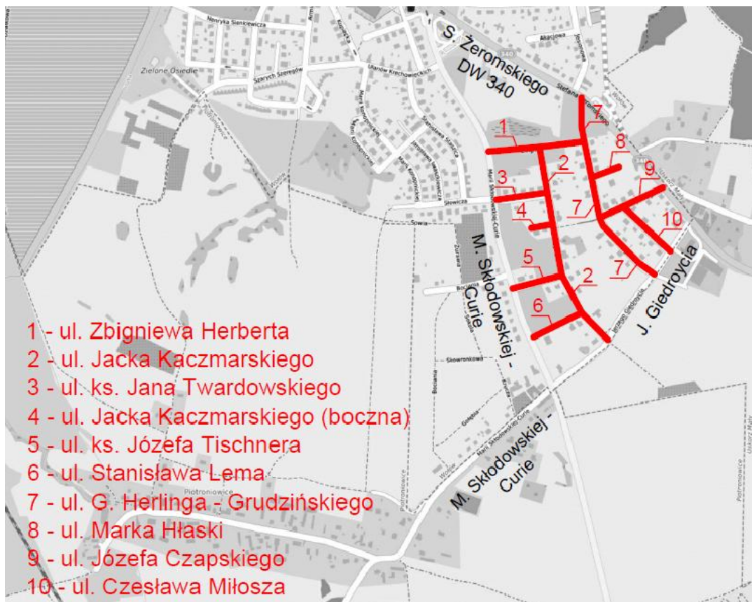
Rys. plan orientacyjny

Ulice Jacka Kaczmarskiego oraz G. Herlinga – Grudzińskiego zaprojektowano jako drogi klasy L – lokalne. Pozostałe ulice objęte opracowaniem zaprojektowano jako drogi klasy D –