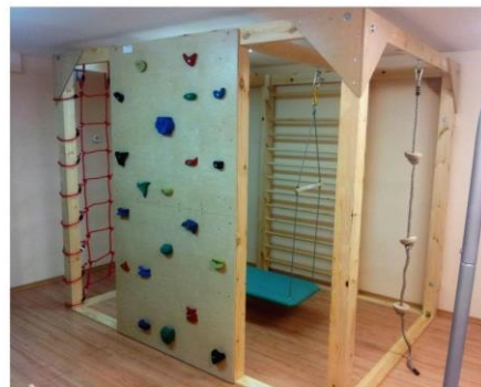
Podglądowy rysunek klatki