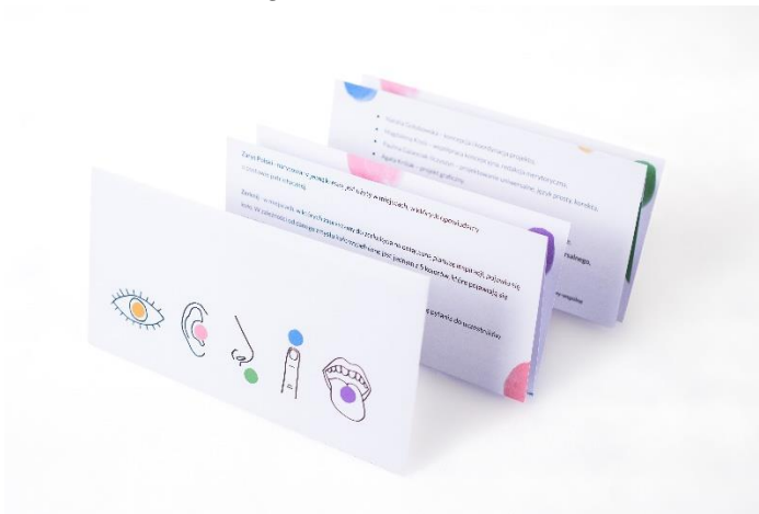
obraz zawierający zdjęcie kopert wraz z kartami informacyjnymi