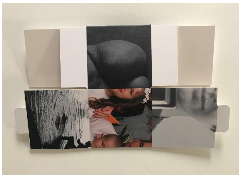
obraz zawierający zdjęcie kostki w formie jaką dostarczy wykonawca