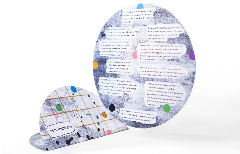
obraz zawierający zdjęcie koła inspiracji