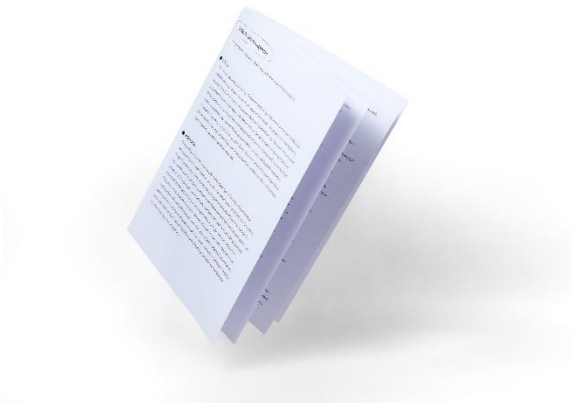
obraz zawierający zdjęcie bookletu