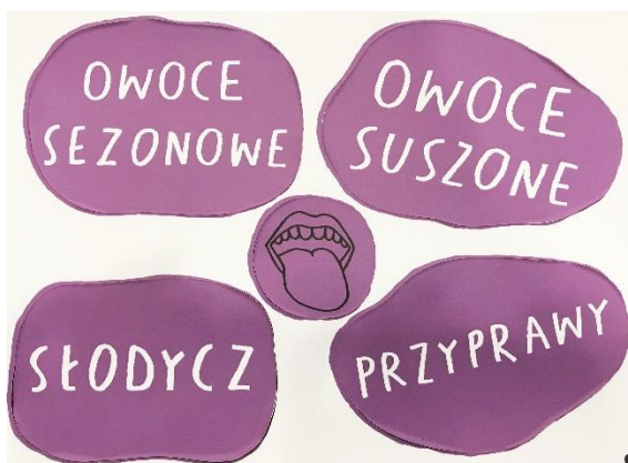
obraz zawierający zdjęcie zaprasowanki