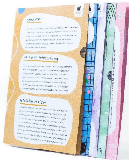
obraz zawierający zdjęcie zestawu pięciu placówek ciekawostek