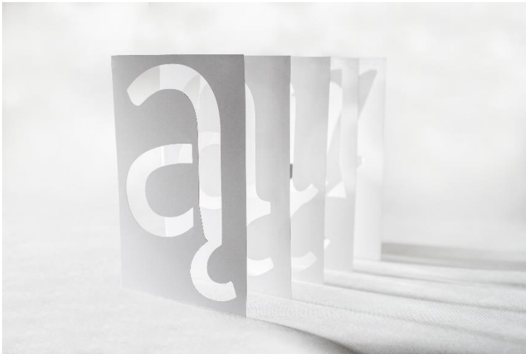
obraz zawierający wizualizację szablonu