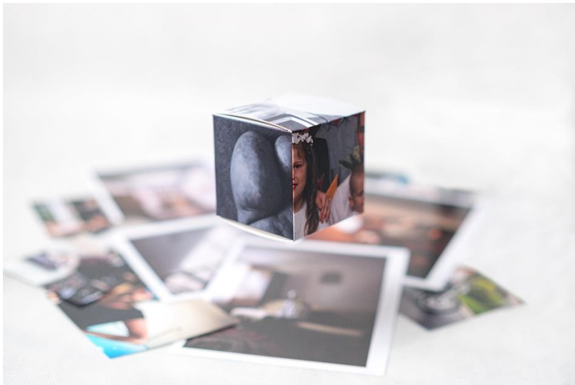
obraz zawierający zdjęcie złożonej kostki