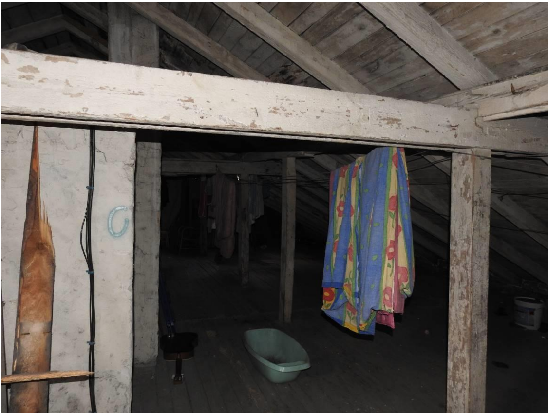
Fot. 9. Strych budynku, brak śladów obecności nietoperzy.