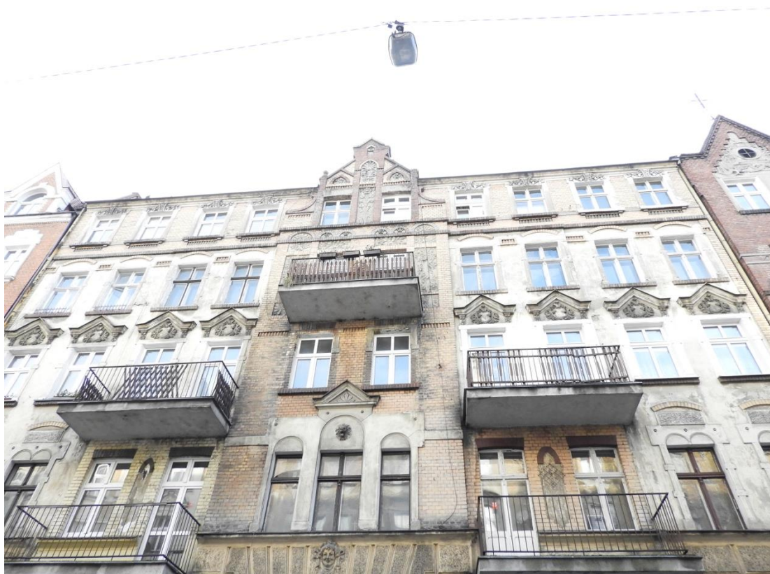
Fot. 1. Elewacja od strony ulicy Kilińskiego.