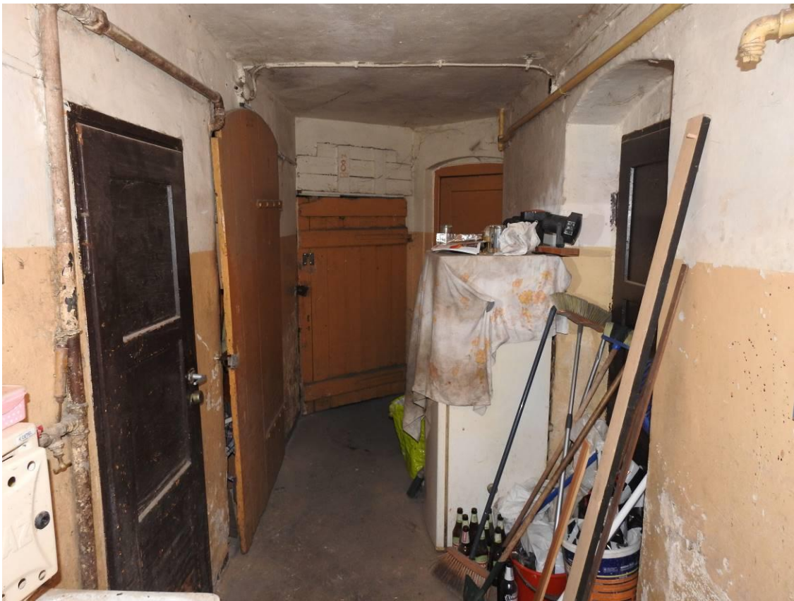
Fot. 10. Piwnica budynku, brak śladów obecności nietoperzy.