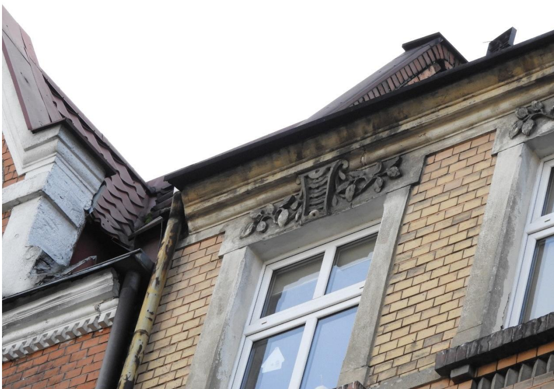
Fot. 3. Elewacja od strony ulicy Kilińskiego.