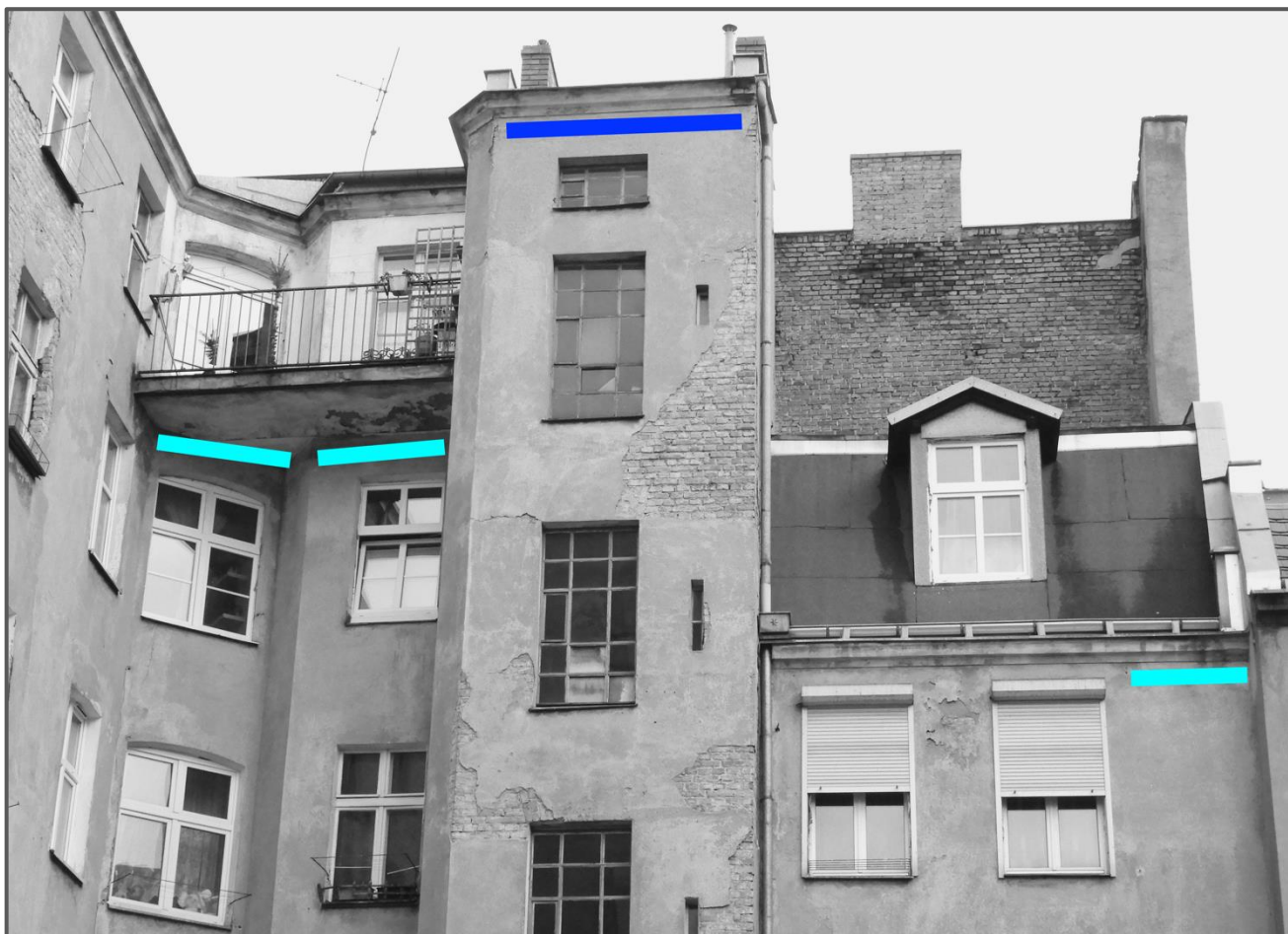
Ryc. 2. Działania kompensacyjne – proponowane miejsca powieszenia budek dla jerzyka. Granatowa linia - elewacja klatki schodowej, jasne niebieskie linie - pod płytą balkonową oraz przy krawędzi kamienicy pod dachem.

powieszeniem muszą zostać zaakceptowane przez ornitologa (jakość wykonania).