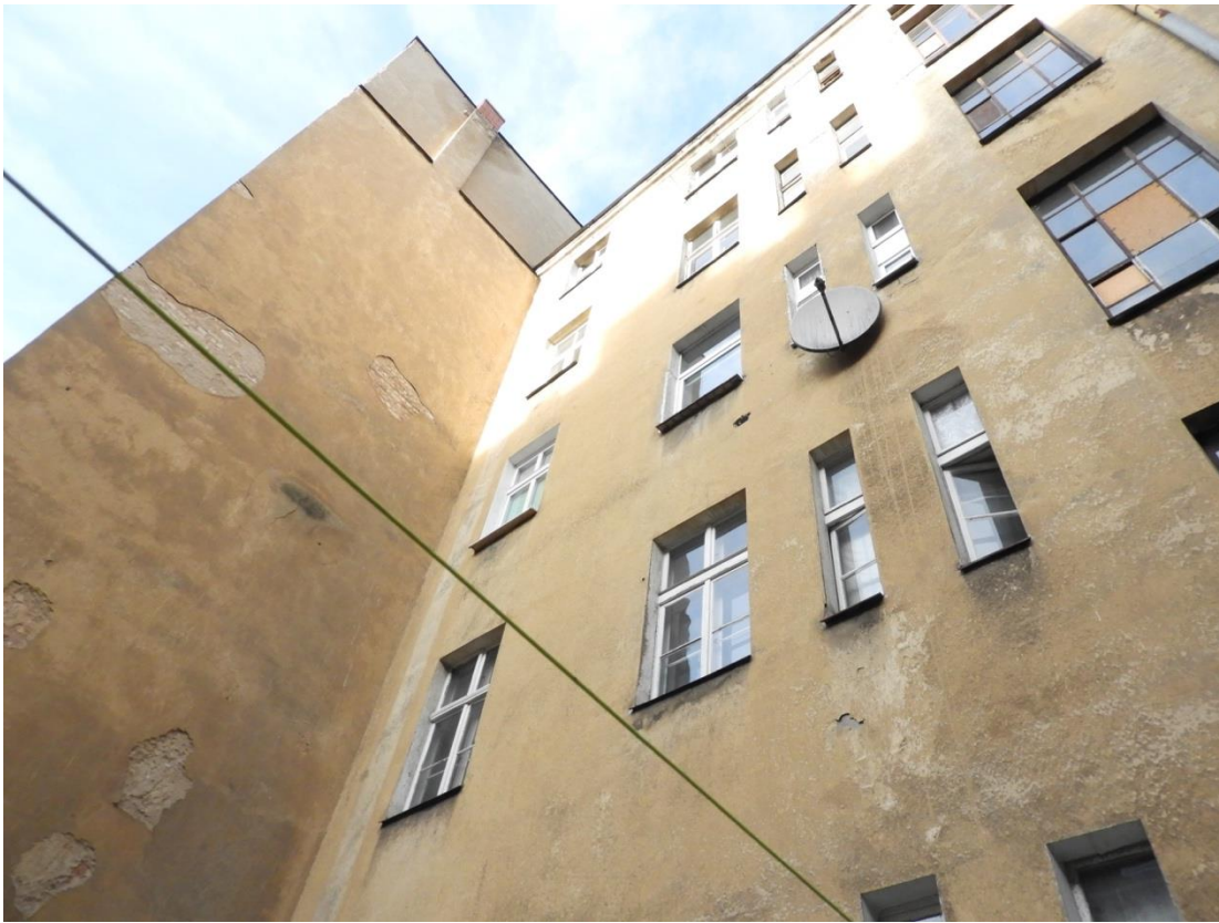
Fot. 5. Elewacja od strony podwórza. Po lewej oficyna przy Kilińskiego 5.