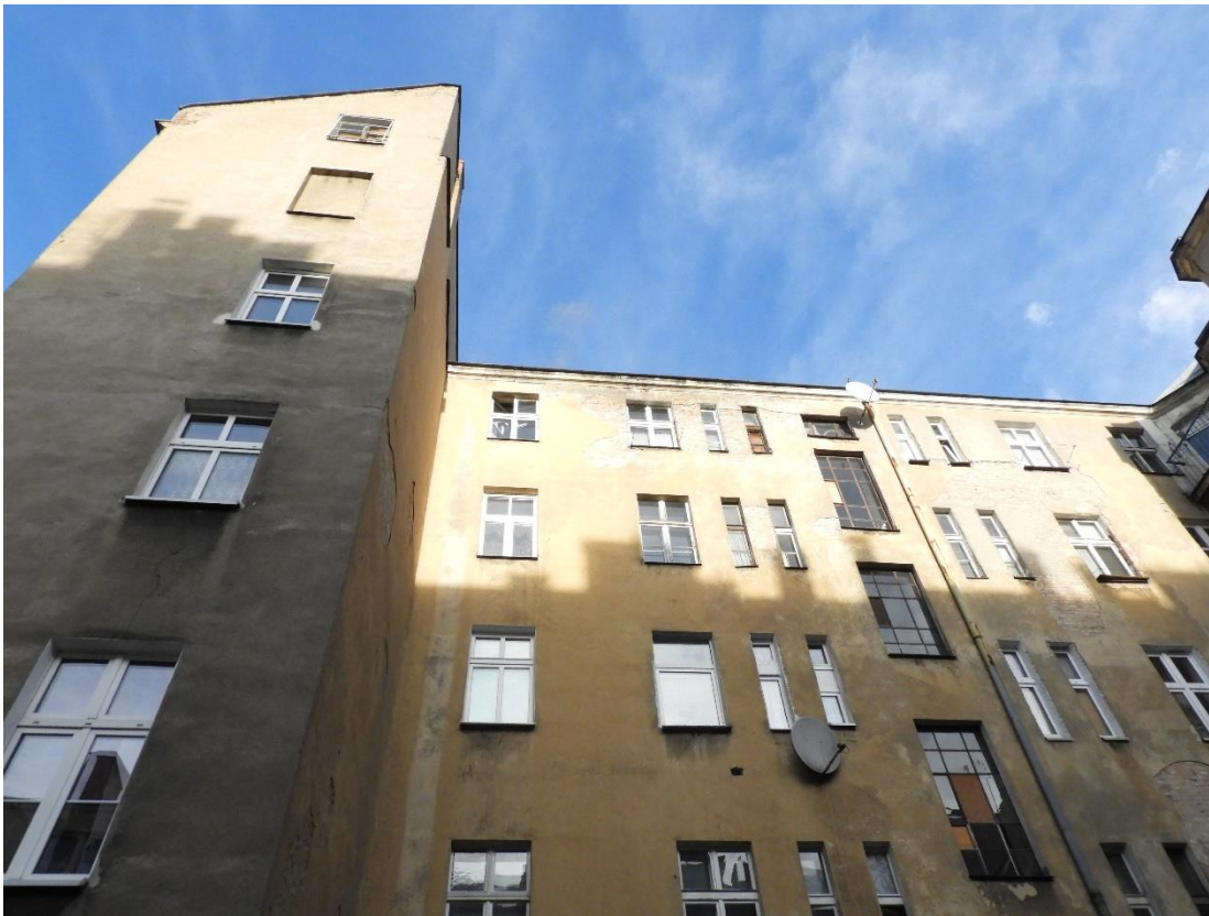
Fot. 7. Budynek kamienicy od strony podwórza. Po lewej stronie oficyna budynku przy ul. Kilińskiego 5.