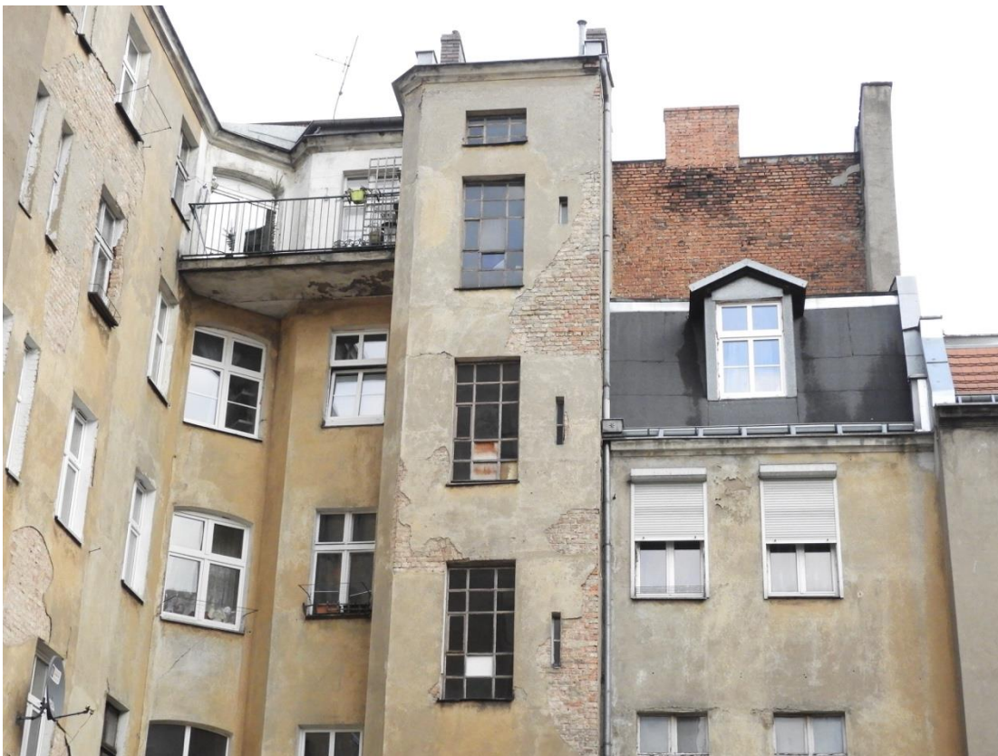
Fot. 6. Elewacja od strony podwórza, oficyna.