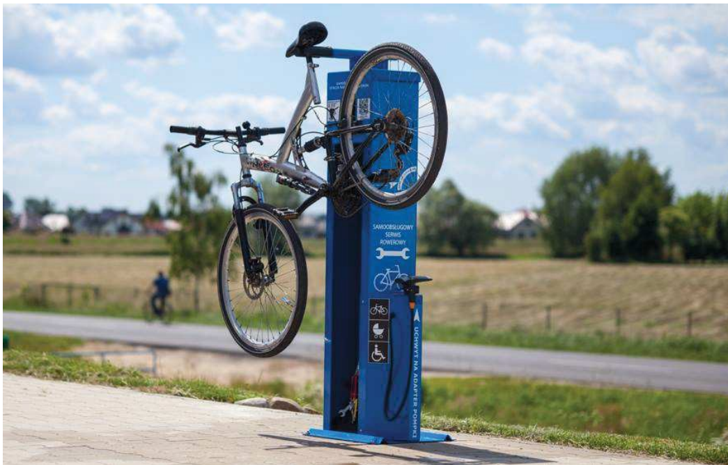
Rys 10. Widok przykładowej stacji naprawy rowerów

Ponadto w ciągu drogi rowerowej przewiduje się zlokalizowanie pojedynczych ławek przeznaczonych na odpoczynek. Dodatkowo przy każdej parze ławek przewiduje się ustawienie jednego drewnianego stojaka na rowery (5-cio stanowiskowego) i jednego drewnianego kosza na śmieci.